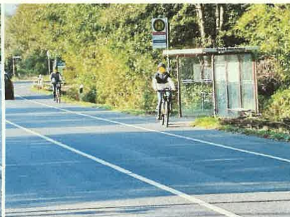
(e) Radfahrende aus nördlicher Richtung kommend passieren den entgegenkommenden Gegenverkehr und die Bushaltestelle „auf der falschen Seite“, aber wie angeordnet.