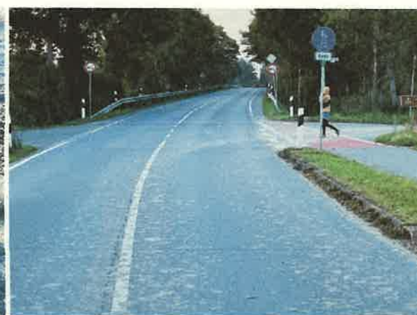
(i) Aus der Fahrzeugführungsposition gesehen verdecken sich einzelne Schilder (rechte Seite hinter Einmündung).