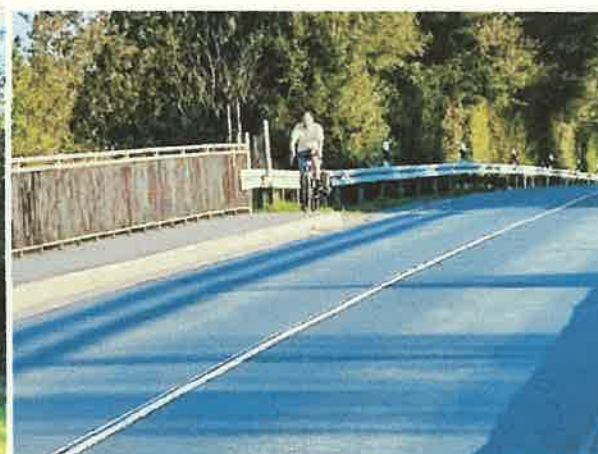
(g) Ein*e Radfahrer*in entscheidet sich für die Herausforderung, über die Brückenkappe zu fahren und geht das Risiko ein, vom Schrammbord zu stürzen.