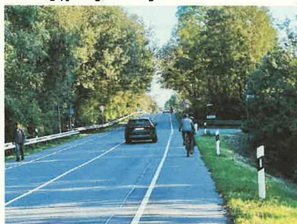
(f) Radfahrende bleiben (ordnungswidrig) lieber auf dem Fußgängerseitenstreifen; das Überholverbot wird dementsprechend von Autofahrer*innen als nicht zur Situation gehörend ignoriert, da sich die Radfahrer*innen nicht in der Fahrbahn befinden.