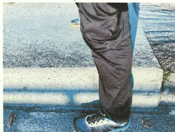
(h) Wahrscheinlich schon zu Fuß ein unangenehmer Abstieg, mit dem Fahrrad ganz sicher ein schwerer Sturz: Höhenunterschied des Schrammbords zwischen Seitenstreifen und Fahrbahn.