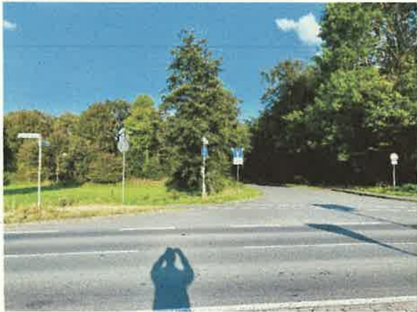
(a) Blick über die Straße von der Zufahrt zu Haus Nr. 343 in Am Rüschaus. Der von Norden (links im Bild) kommende stadteinwärtige Radweg wird durch Markierungen auf der „falschen“ Seite weitergeleitet.