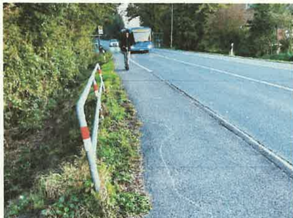
(d) Ein E-Scooter-Fahrer benutzt den Seitenstreifen unbewusst korrekt, da auf seiner Seite in seiner Fahrtrichtung keine Beschilderung auf den benutzungspflichtigen Radweg hinweist.