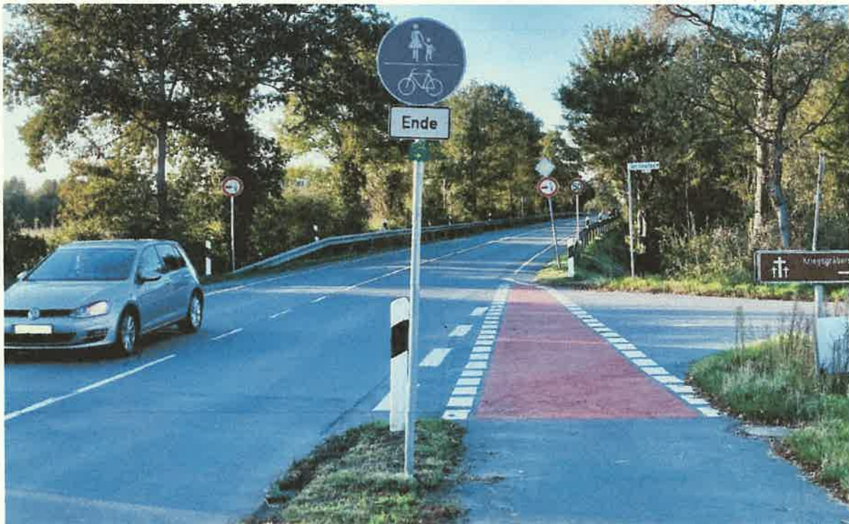
(c) Blick von Süden stadtauswärts die Brücke hinauf. Im Vordergrund ist rechts die Einmündung der Straße Am Gievenbach. Hier deutet sich bereits an, dass die Beschilderung sich aus Sicht des motorisierten Verkehrs gegenseitig verdecken. Auch die problematische Linienführung der Rotmarkierung bei fehlenden Anordnungen für Fuß- und Radverkehr hinter der Einmündung ist gut zu erkennen.