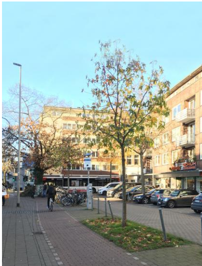
Parkplatz Bült - Bestandssituation