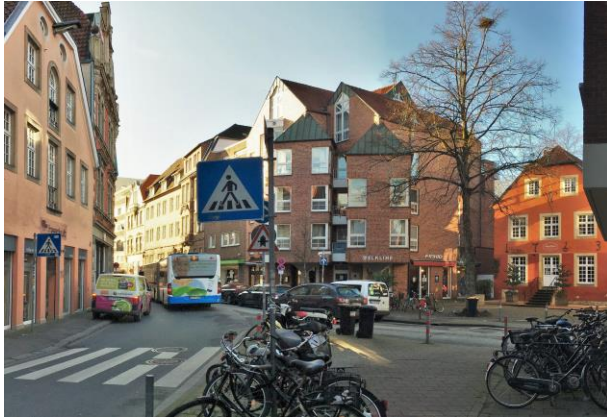
Martiniplatz - Bestandssituation