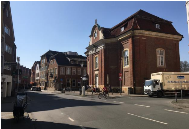
Lotharinger Platz – Bestandssituation