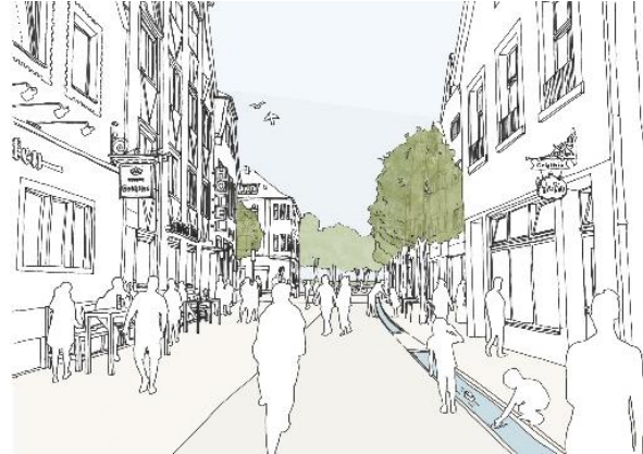
Straßenraum Hörsterstraße - Skizze