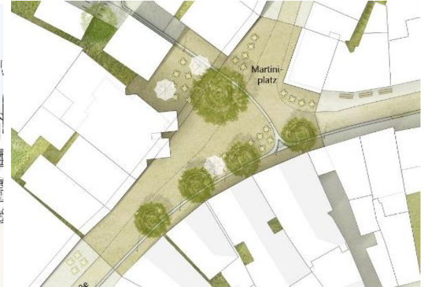
Martiniplatz – Ausschnitt Lageplan