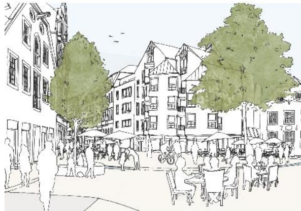
Martiniplatz - Skizze