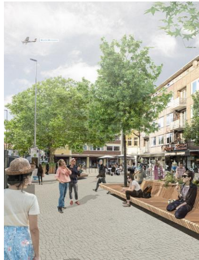
Parkplatz Bült - Animation