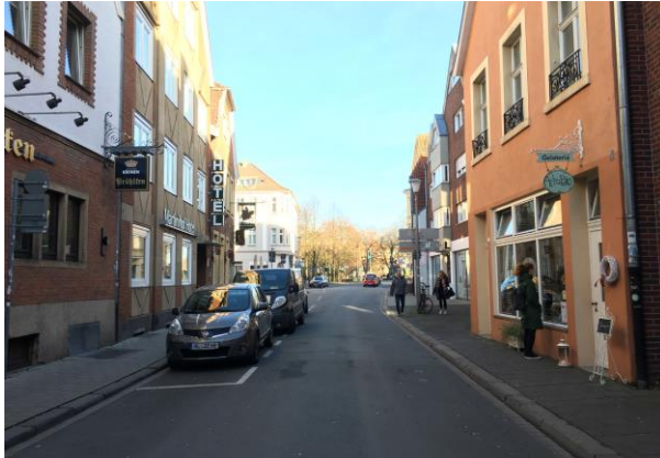
Straßenraum Hörsterstraße - Bestandssituation