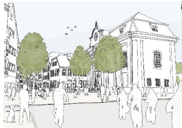
Lotharinger Platz – Skizze