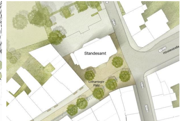
Lotharinger Platz – Ausschnitt Lageplan