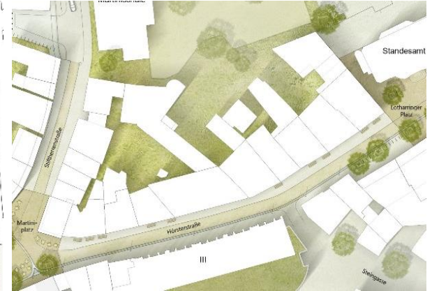
Straßenraum Hörsterstraße – Ausschnitt Lageplan