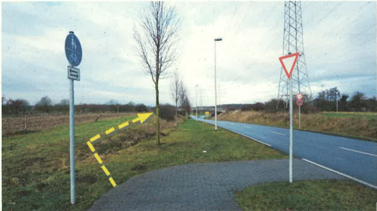
Fritz-Stricker-Straße heute: Hier endet der Fuß- und Radweg, im Hintergrund sieht man die Brücke „Schlautbogen“, gelb: mögliche Fortsetzung des Weges