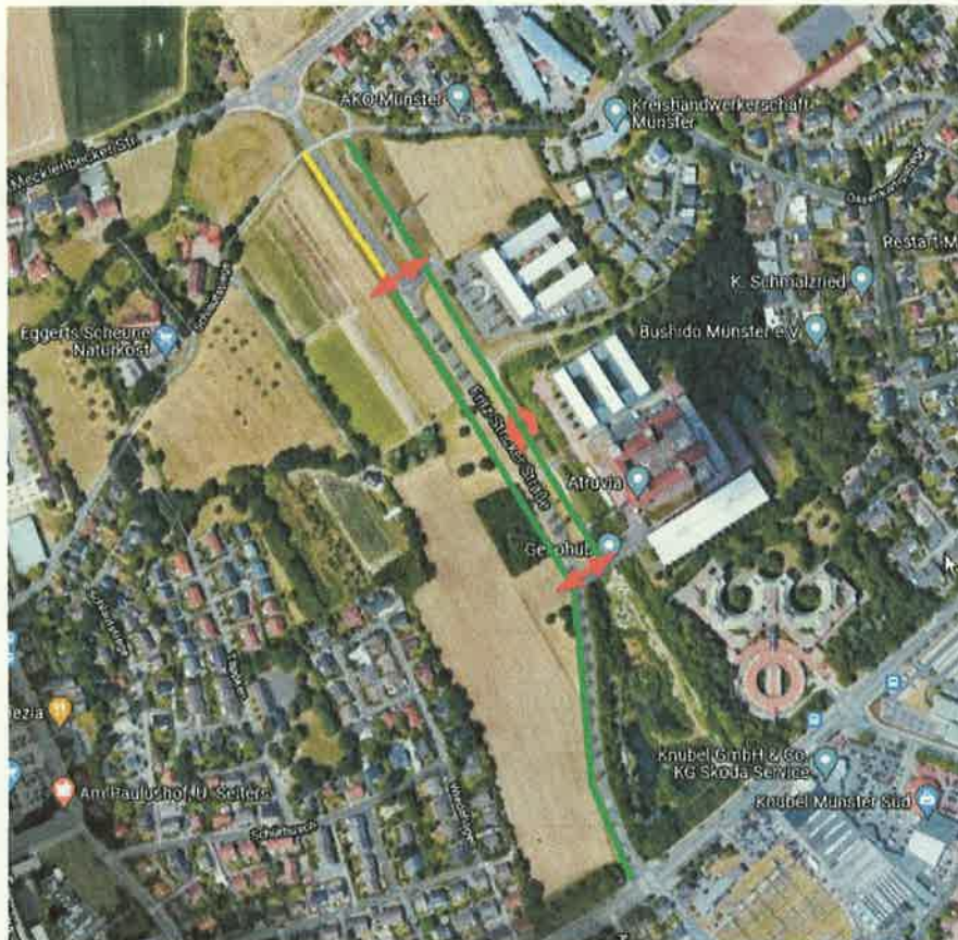
Legende (auf Basis Quelle: Google): grün = vorhandene Wegeteile gelb = fehlendes Wegestück rot = wg. fehlendem Wegestück erforderliche Querung