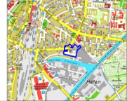
Anlageblatt 2: Lageplan mit Darstellung der Nutzungsvereinbarung im Erdgeschoss