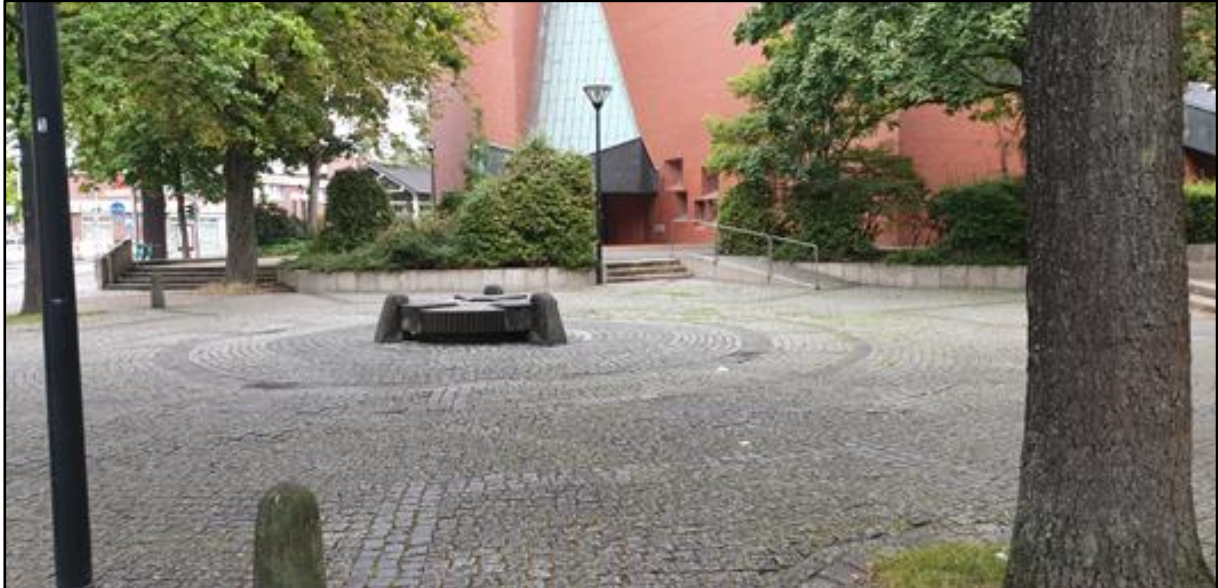
Abb. 1 Brunnenanlage Michaelkirche-Brunnen-51°58'03.2"N 7°34'48.9"E

Die wassertechnische Anlage befindet sich an der Kreuzung Sankt-Josef-Kirchplatz und Hammer Straße.