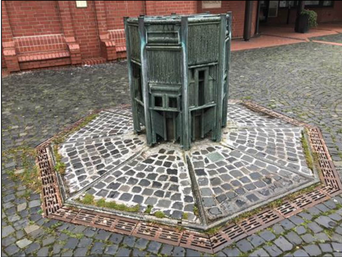
Abb. 1 Anlage Idenbrockplatz Koordinaten - 51°59'45.0"N 7°36'11.5"E

Die wassertechnische Anlage befindet sich in Kinderhaus auf dem Idenbrockplatz in Münster.