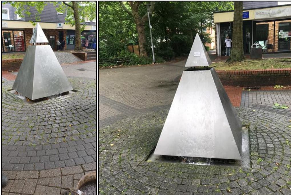
Abb. 1+2 Anlage Sprickmannplatz Brunnen Koordinaten - 51°59'56.3"N 7°35'41.7"E

Die wassertechnische Anlage befindet sich in Kinderhaus auf dem Sprickmannplatz in Münster.