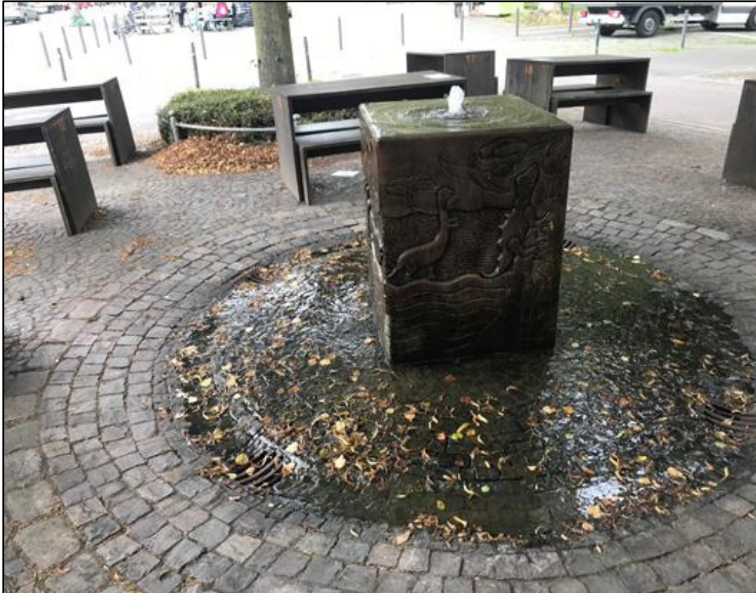
Abb. 1 Brunnenanlage Joseph-Kirchplatz -51°56'58.7"N 7°37'29.5"E

Die wassertechnische Anlage befindet sich an der Kreuzung Sankt-Josef-Kirchplatz und Hammer Straße.