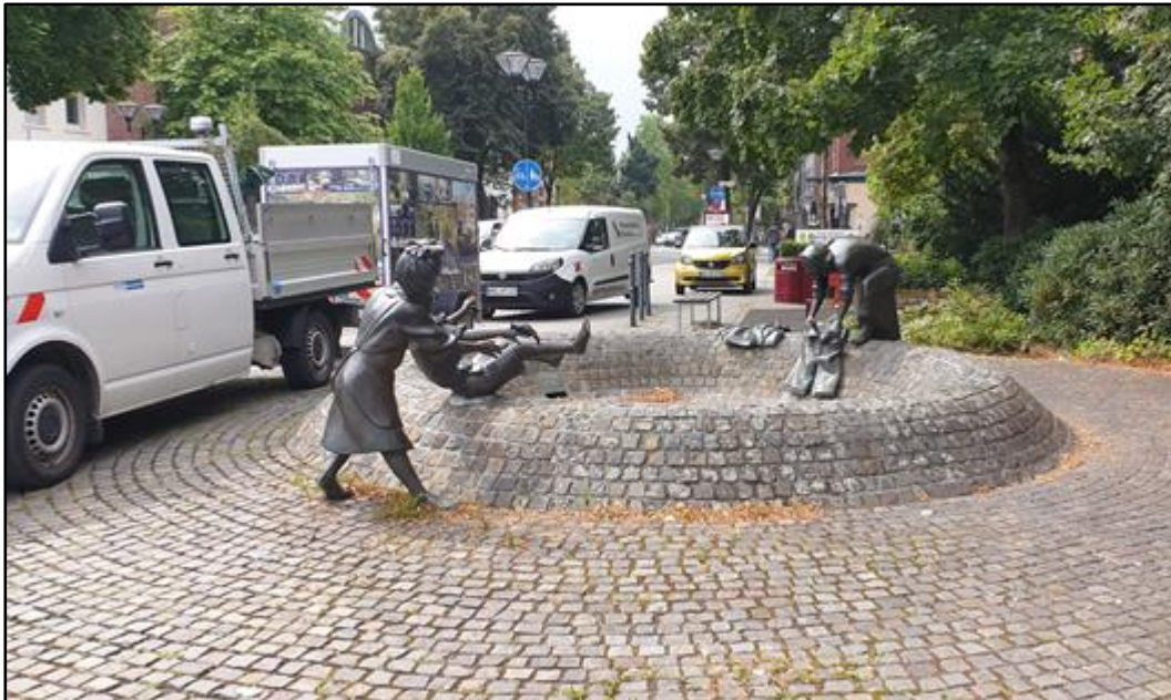
Abb. 1 Anlage Koordinaten - 51°54'14.1"N 7°38'30.6"E

Die wassertechnische Anlage befindet sich an der Kreuzung Marktallee und Hohe Geest in Münster.