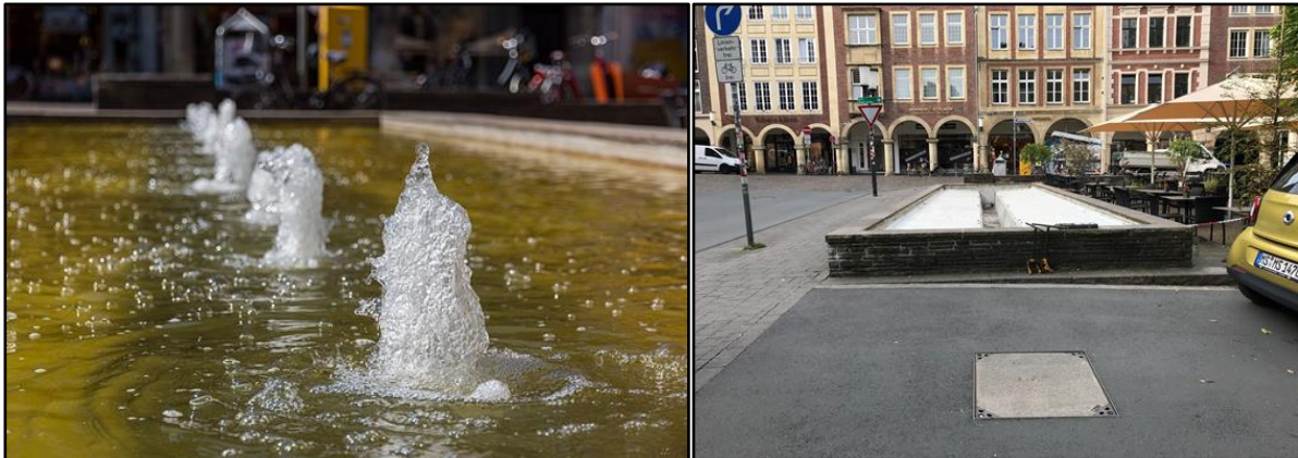
Abb. 1 + 2 Wasserbild Brunnenanlage

| Wasserbecken Neubrückenstr. Im Bestand