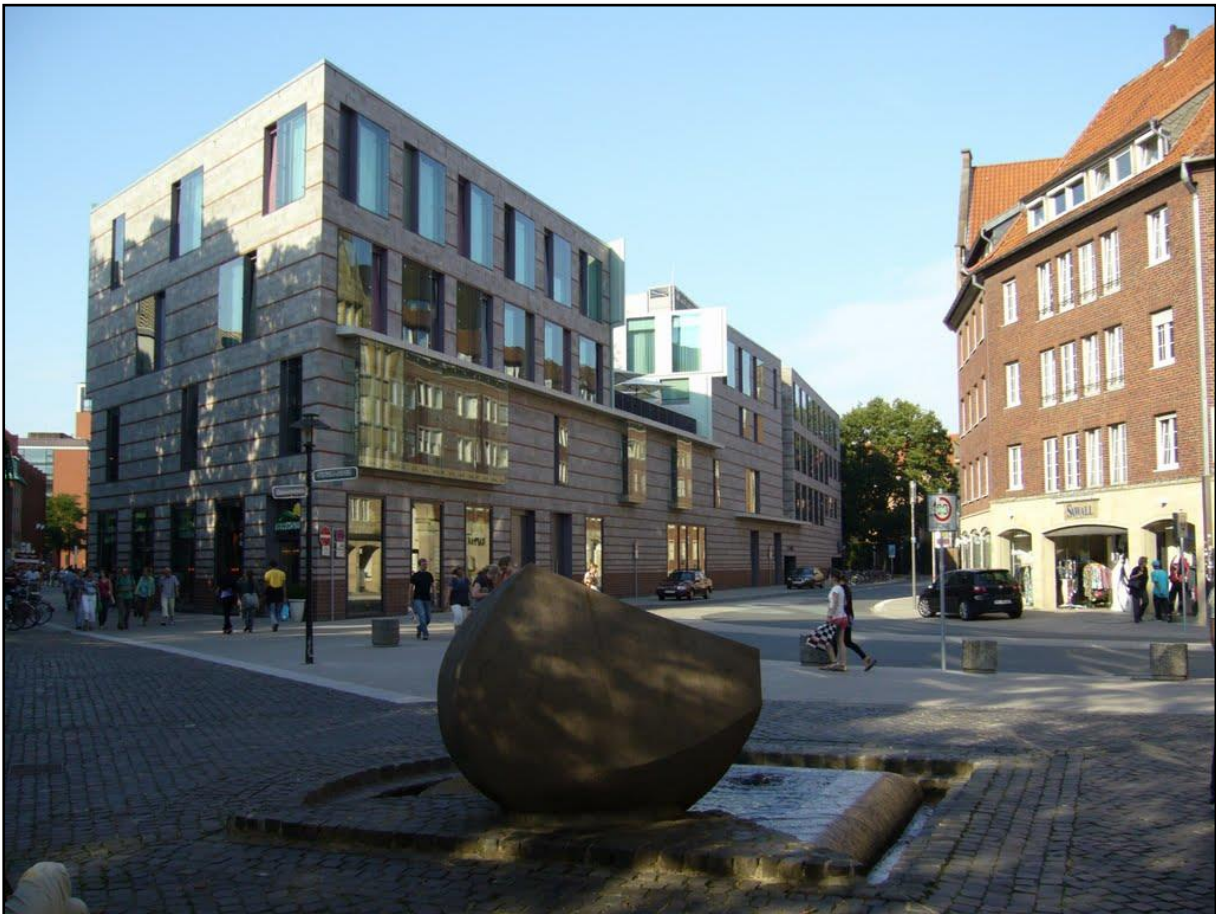
Abb. 1 Wasserbild Harsewinkelplatz Brunnen Koordinaten - 51°57'32.4"N 7°37'44.4"E

Die wassertechnische Anlage befindet sich in der Stadtmitte in Münster.