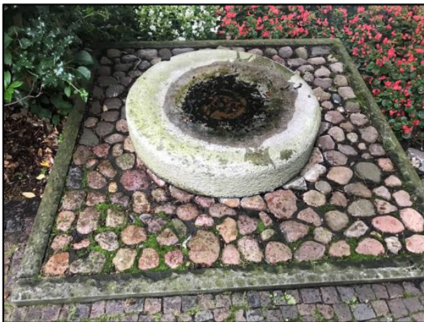
Abb. 3 Brunnen 3_Abmessung ca. 1,80 x 1,80 _ D ca. 1,0 m

Die wassertechnische Anlage befindet sich an der Kreuzung Mauritzstraße / Eisenbahnstraße in Münster.