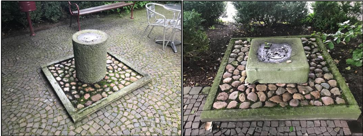
Abb. 1 + 2 Brunnen 1_Abmessung ca. 1,20 x 1,20 _ DSäule ca. 0,45 m | Brunnen 2_Abmessung ca. 1,50 x 1,50 _ Stein ca. 0,7x0,7 m