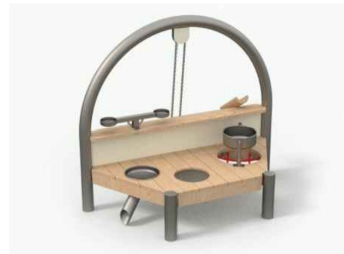
16 Sandkuche Kobito "Tomi"