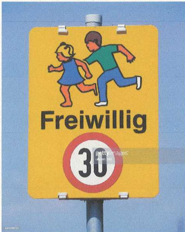
(a) „Freiwillig Tempo 30“, so auch an der Welsingheide/Oberort gesehen