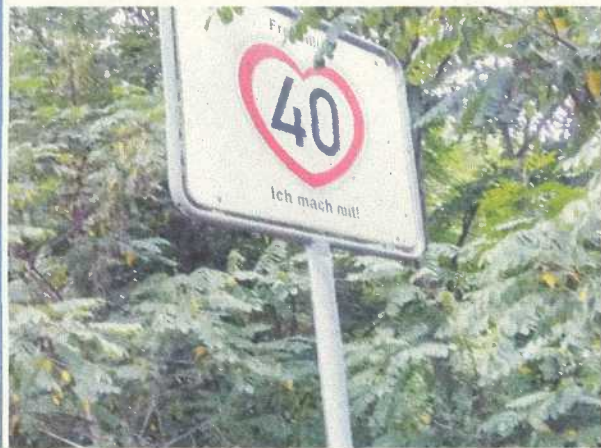
(b) „Tempo 40“, so gesehen bei Neuruppin/Brandenburg