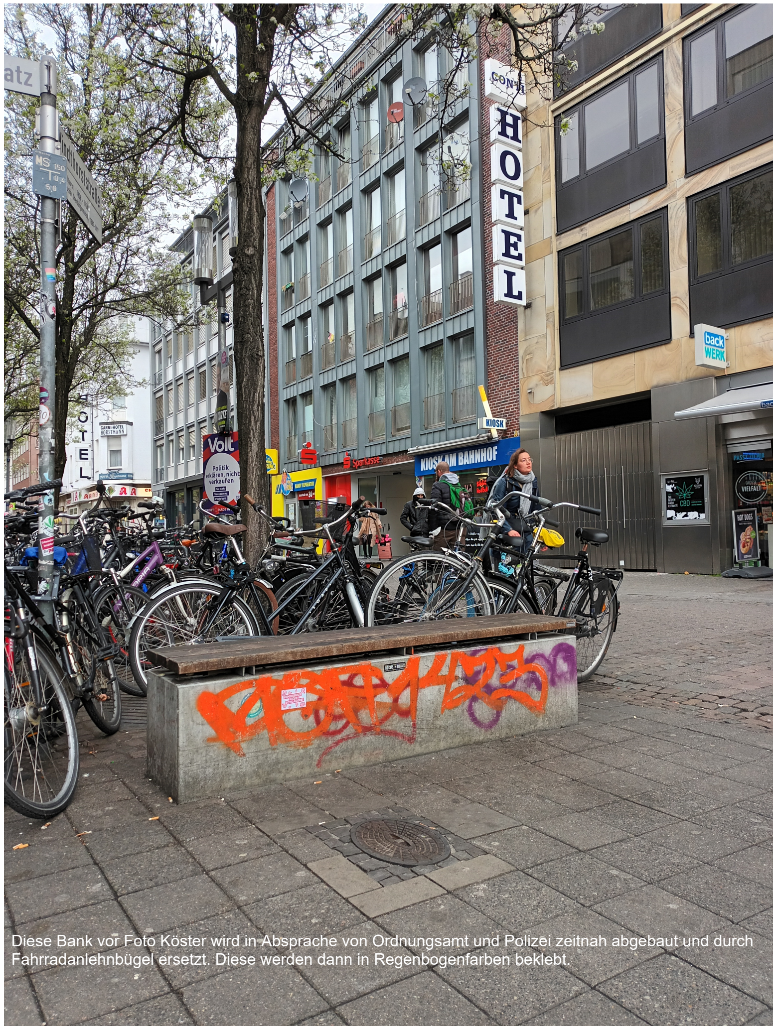
Diese Bank vor Foto Köster wird in Absprache von Ordnungsamt und Polizei zeitnah abgebaut und durch Fahrradanhänger ersetzt. Diese werden dann in Regenbogenfarben beklebt.