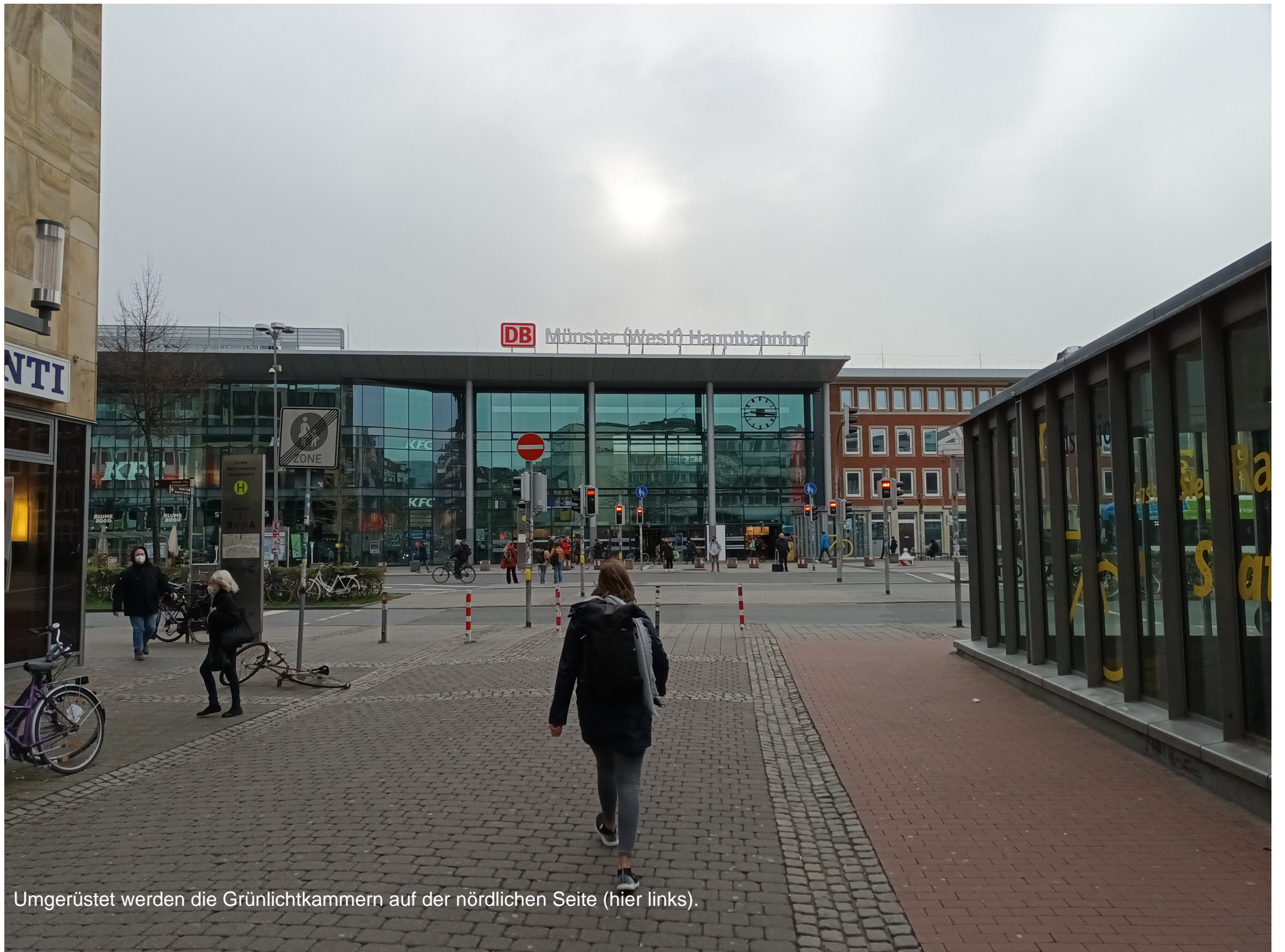
Umgerüstet werden die Grünlichtkammern auf der nördlichen Seite (hier links).