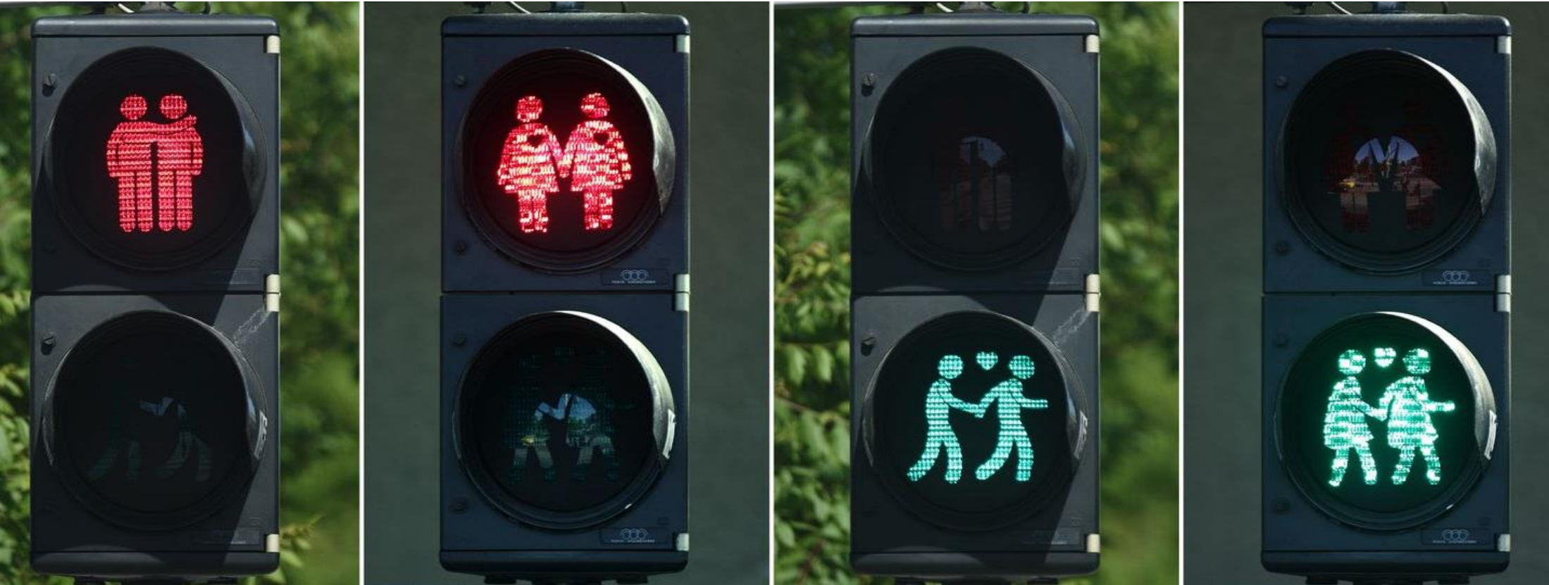
Umsetzung nur in den Grünlichtkammern zusätzliches drittes Symbol mit Paarkonstellation w/m