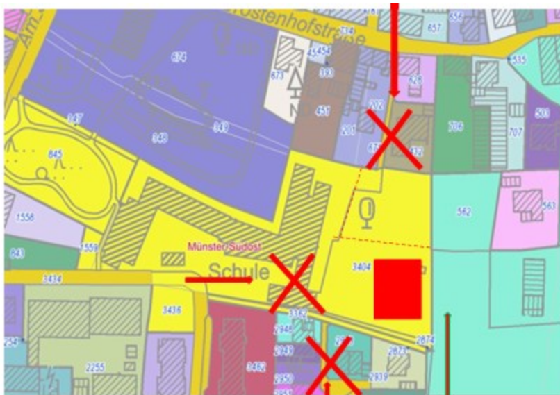
Baustellenzufahrten zur Erweiterung der Nikolaischule-Wolbeck

In der Konsequenz ist es folgerichtig, durch das Aufheben dieser Beschlüsse eine neue Ausgangssituation zu schaffen, um auf veränderte Bedingungen bedarfsgerechtere Lösungen entwickeln zu können.