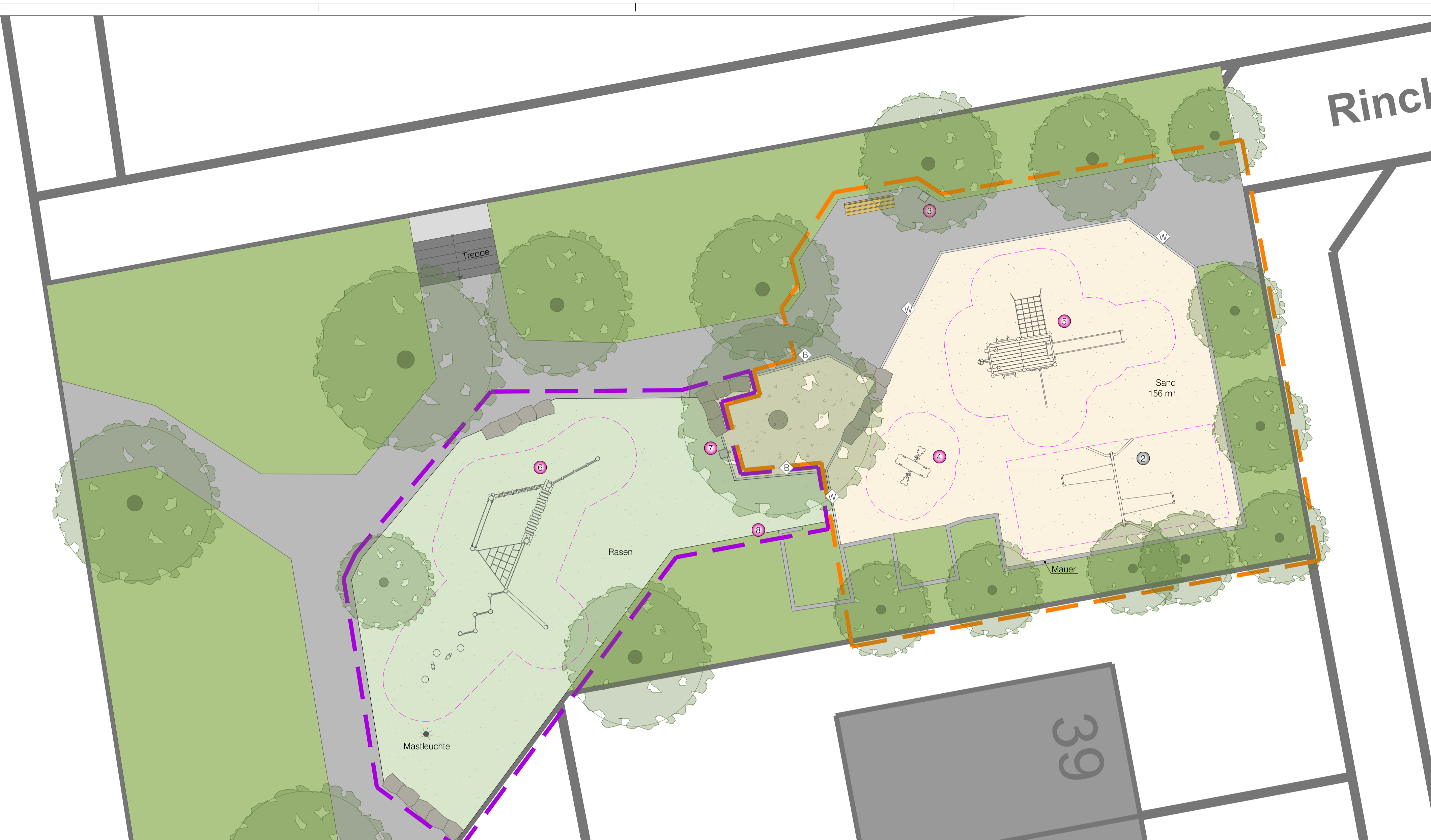
Bestand M 1:200