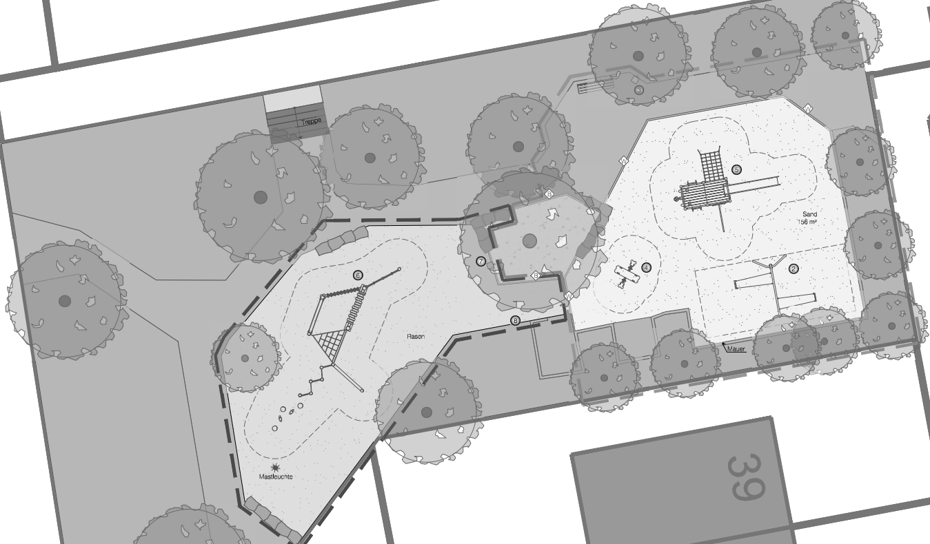
Bestand M 1:200