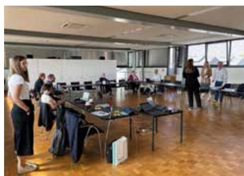
Der Workshop am 10. Mai 2022