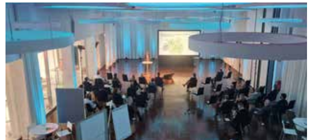
Der Workshop am 1. April 2022

Um diese Potenziale auch heben zu können und in Wertschöpfung für das Messe und Congress Centrum Halle Münsterland sowie in Entwicklungsimpulse für den Standort zu verwandeln, ist allerdings konsequentes strategisches Handeln zwingend. Workshop 2 formulierte Handlungsempfehlungen, um die Transformation einzuleiten. Zudem wurden dort die Positionierungsansätze zu einem Zielbild verdichtet.