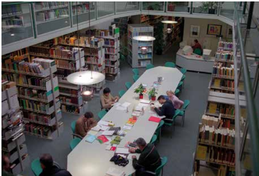
60.000 Studierende prägen die Stadt – einer der prägenden Faktoren für den Business Event Standort Münster.

Das große Potenzial der Stadt als Eventraum und Spielort für Business Events und ihr Selbstverständnis wird unter anderem in folgenden Schlagworten deutlich: