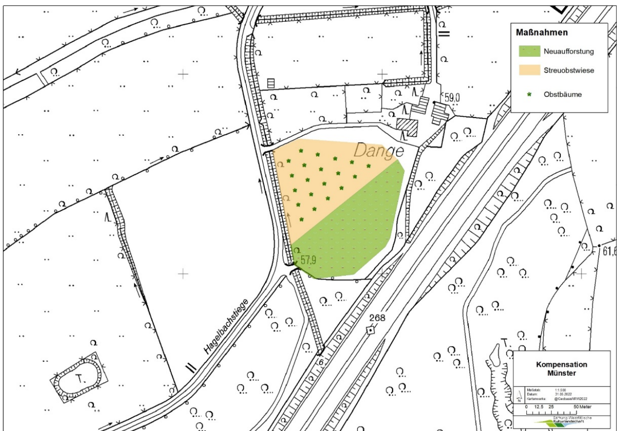
Abbildung 1: Lage der Ausgleichsfläche 1, Stadt Münster, Gemarkung Nienberge Flur 6, Flurstück 37 Maßnahmengröße 14.245 m 2 , Quelle Stadt Münster

Als Ausgleichsflächen werden Flächen in der Gemarkung Nienberge, Flur 5, Flurstück 6 (tlw.) und Flur 6, Flurstück 37 herangezogen. Die Beschreibung der Maßnahmen kann den Maßnahmenblättern in der Anlage entnommen werden. Die Stadt wird hierzu eine vertragliche Regelung nach § 11 mit der Flächeneigentümerin treffen, so dass eine Festsetzung nicht erforderlich ist.