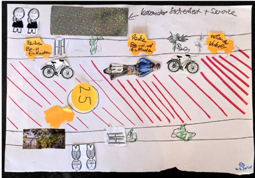
Neuaufteilung des Straßenraums