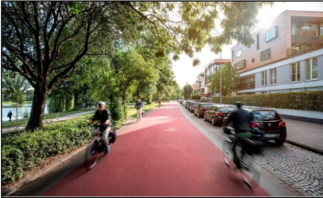
Abb. 4: Fahrradstraße Bismarckallee