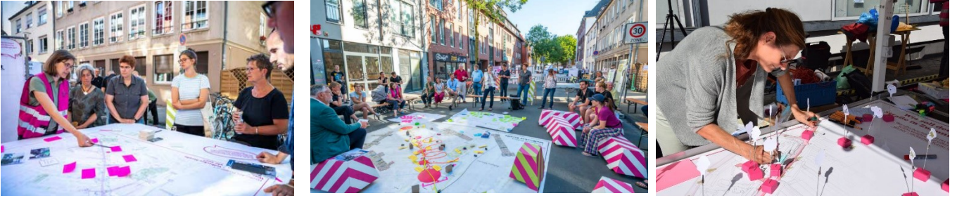
Abb. 9-11: Beispiel einer aufsuchenden Beteiligung – Öffentliche Werkstatt auf der Wolbecker Straße am 27. Juni 2022