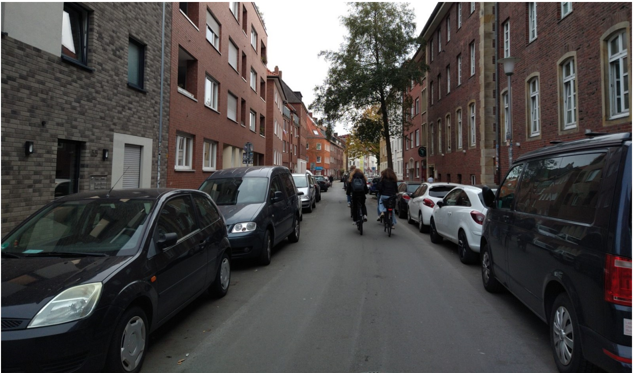
Abb. 7: Schillerstraße zwischen Soester Straße und Dortmunder Straße, Blickrichtung stadtauswärts