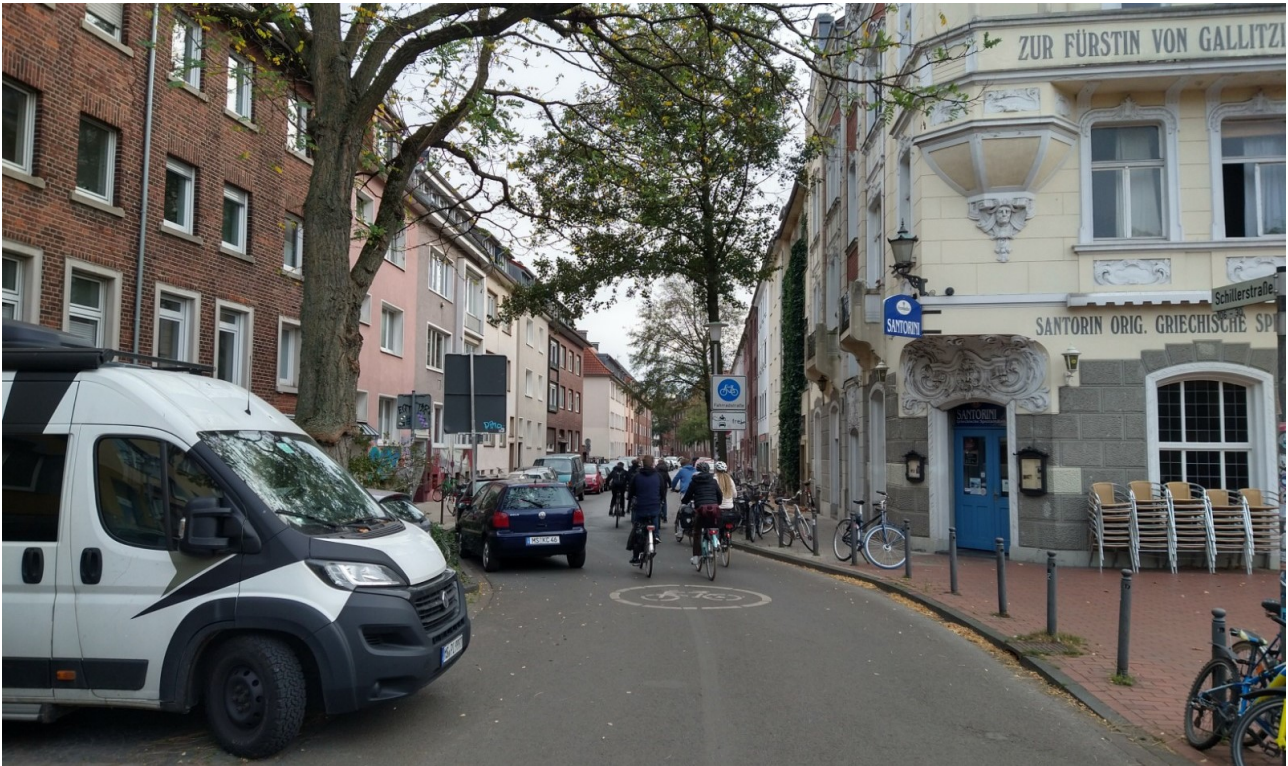
Abb. 6: Blick von der Kreuzung Schillerstraße/Soester Straße in die Schillerstraße, Blickrichtung stadtauswärts