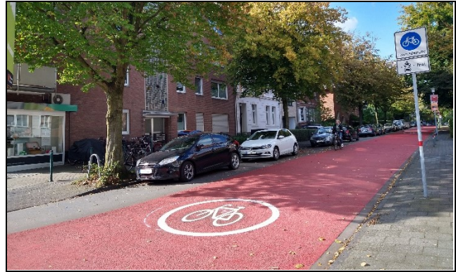
Abb. 5: Fahrradstraße Hittorfstraße