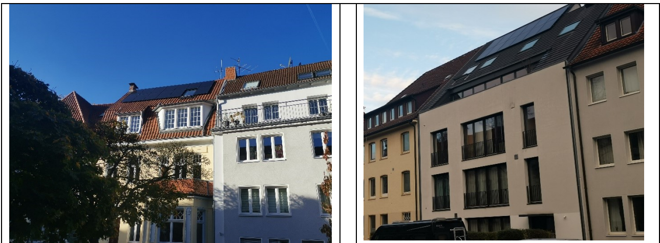
Bereits realisierte Solaranlagen in der Gertrudenstraße und in der Kampstraße

mit bis zum 30.11.2022 insgesamt 152 genehmigten oder als zulassungsfähig in Aussicht gestellten Solarmodulen.