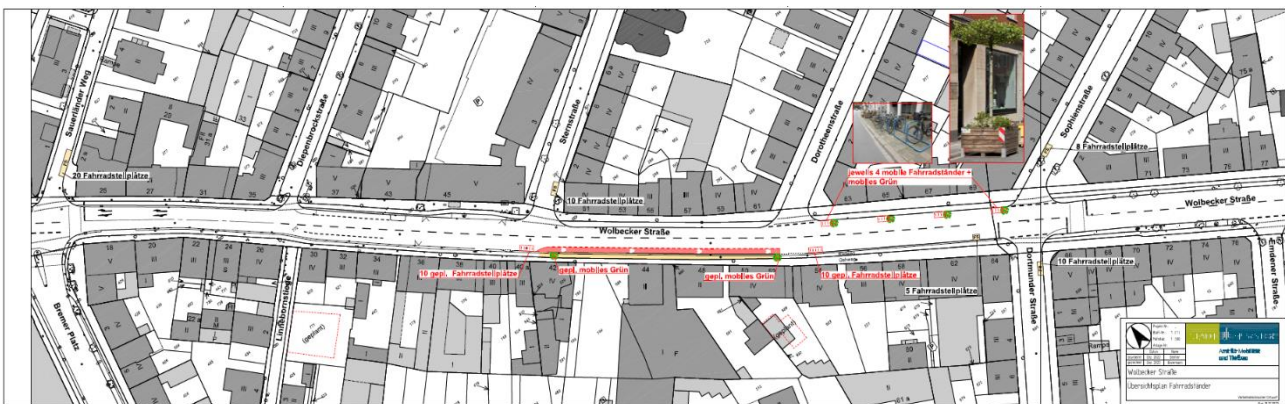
Fahradstellplätze und mobiles Grün: geplante und umgesetzte Standorte

Bis Oktober 2022 wurden insgesamt 53 zusätzliche Fahrradstellplätze eingerichtet. Diese zusätzlichen Fahrradstellplätze sind Teil des „3.000-Fahradstellplätze-Programm“ und wurden an von Bürger*innen vorgeschlagenen Standorten eingerichtet. Zusätzlich sind weitere Fahrradstellplätze als Abgrenzung des Fahrradschutzstreifens im mittleren Bereich stadtauswärts sowie als Abgrenzung zum mobilen Grün vorgesehen. Hierzu werden im Frühjahr 2023, im Rahmen der Baumaßnahme „Partieller Schutzstreifen“ und des Aufbaus des mobilen Grüns rund 30 weitere Fahrradstellplätze eingerichtet. Im Zuge dieser Maßnahmen entfallen 8 PKW-Stellplätze.