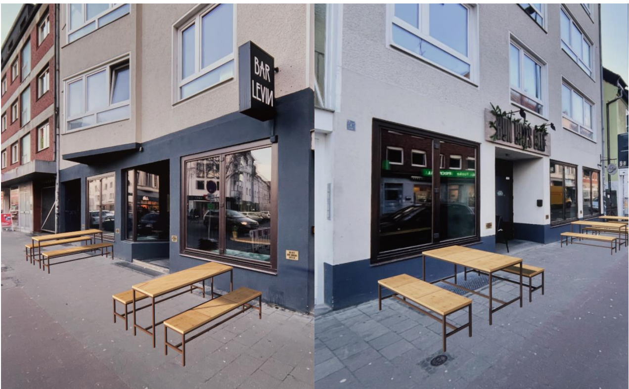
Visualisierung: Mike Gottlob Grafik Design

Im Zuge der Verlagerung des Radverkehrs auf den Gehweg werden auf Höhe der Hausnummern 50/52 auf der dem Haus zugewandten Seite Außensitze für die Gastronomie eingerichtet. Die Einrichtung der Außensitze ist im Anschluss an den Rückbau des Fahrradweges auf der Nebenanlage zum Saisonstart im Frühjahr 2023 geplant und wird gemeinsam mit den anliegenden Gastronomen unter abschnittsweiser Mitnutzung der Nebenanlage als Sondernutzungsfläche umgesetzt (s. Visualisierung).