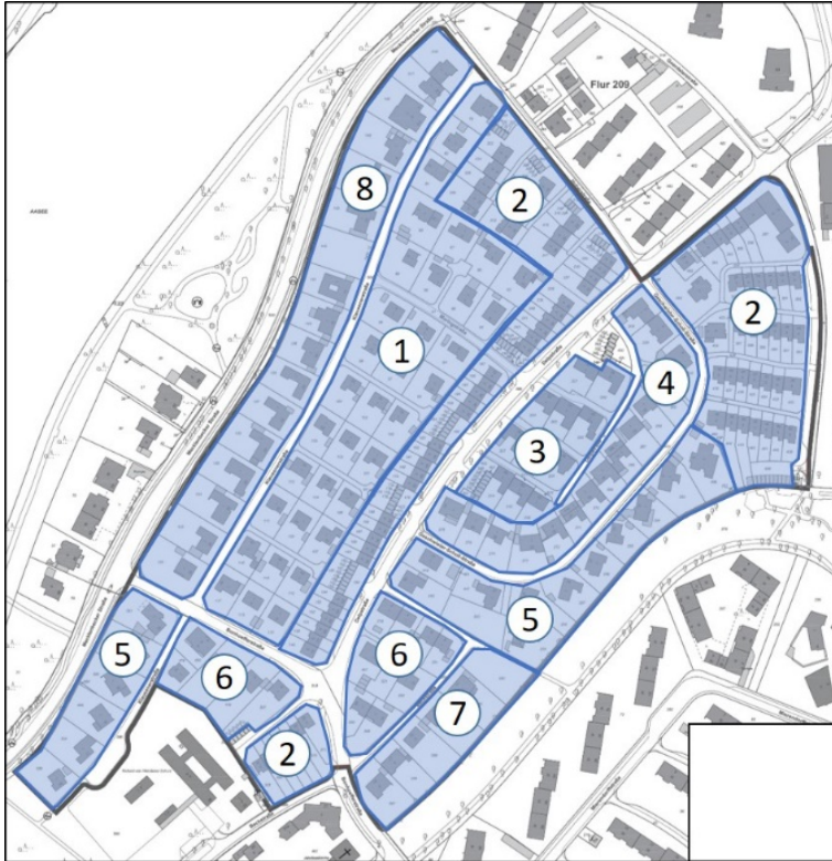
Abbildung 1: Teilbereiche

Die einzelnen Teilbereiche zeigen folgende Prägungen: