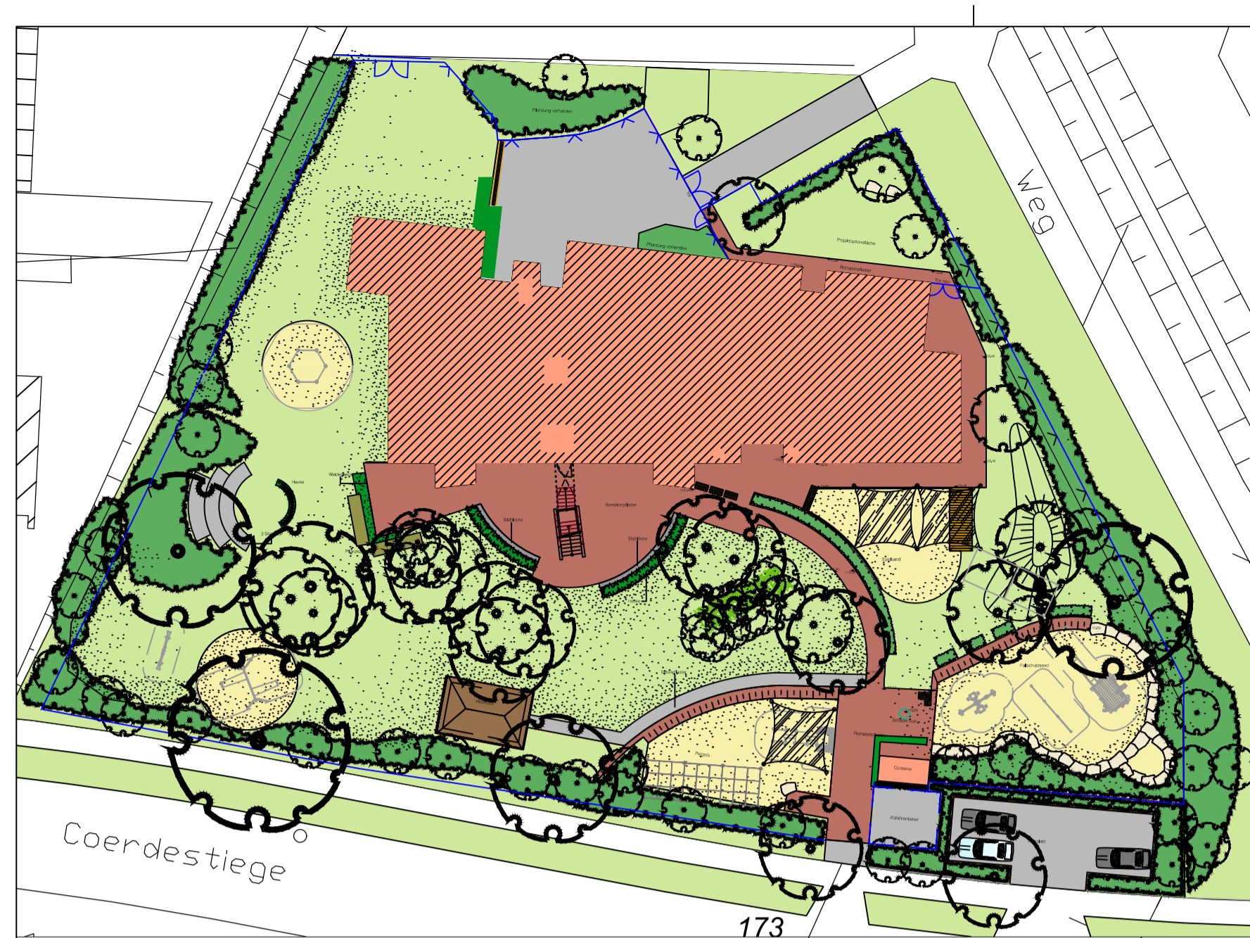
Bestandsplan ohne Maßstab