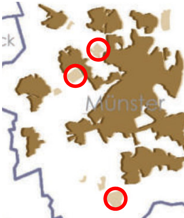
Auszug aus Erläuterungskarte III-1