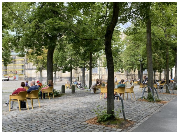
Domplatz – östlicher Teil mit Domplatz-Oase