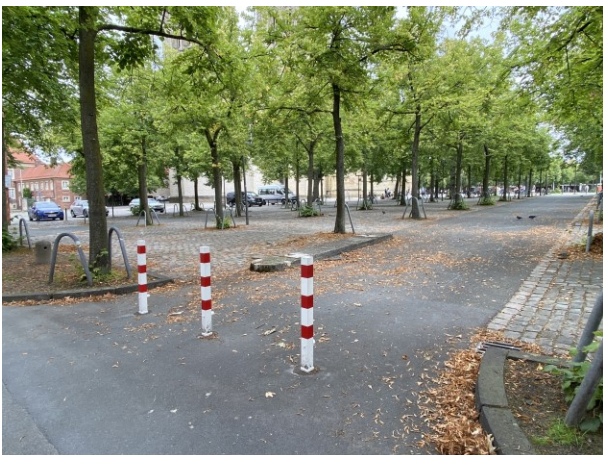
Domplatz – westlicher Teil heute

Das Vergabeverfahren für einen Auftrag für die Begleitung und Durchführung eines Planungsprozesses zur langfristigen Umgestaltung des Domplatzes und -quartiers (gefördert aus dem Bundesprogramm „Zukunftsfähige Innenstädte und Zentren“) soll im Oktober 2023 starten. Der Planungsprozess soll dann Anfang 2024 beginnen. In die Planungen zur dauerhaften Umgestaltung fließen die Erfahrungen mit der Möblierung auf der Ost- und Westseite des Domplatzes ein.