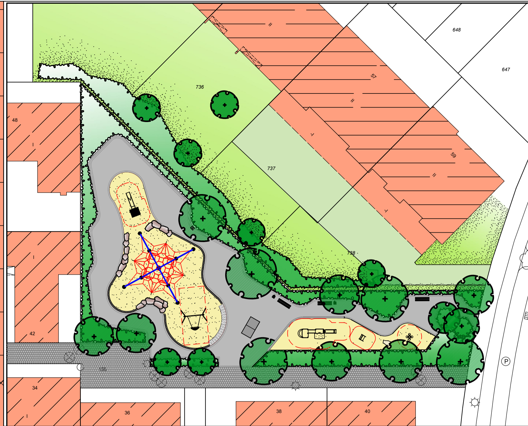
Bestandsplan ohne Maßstab