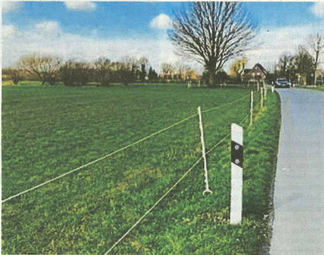
Blick vom Ramerstweg über die jetzt eingezäunten Flächen in Richtung Aa.