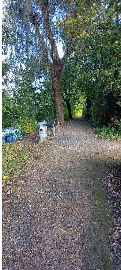
Fußweg in Richtung Alte Furt