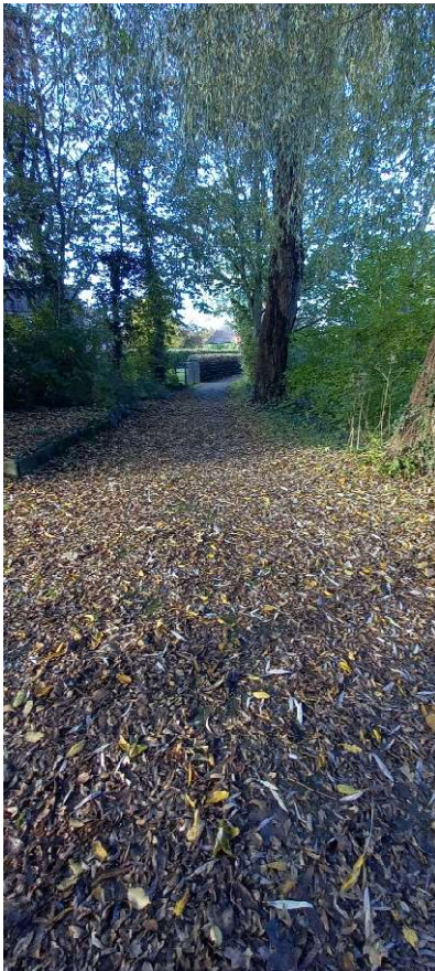
Fußweg in Richtung Davertstraße