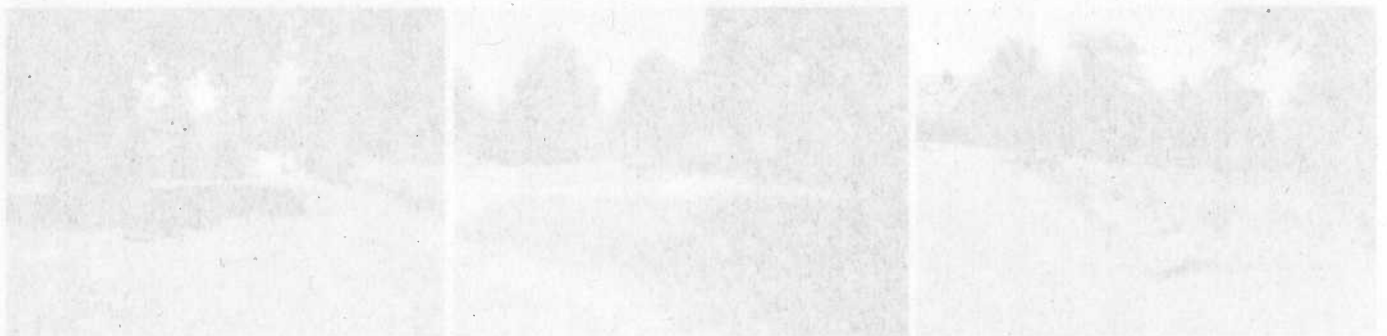
Abb. 3-2: jetziger Bestand

Durch die mit der Freizeitanlage des stillgelegten Spielplatzes verbundene deutlich aufwendigere Pflege und Unterhaltung würden allerdings dauerhafte Mehrkosten entstehen, die im derzeitigen Budget der Grünhaltung nicht zur Verfügung stehen.