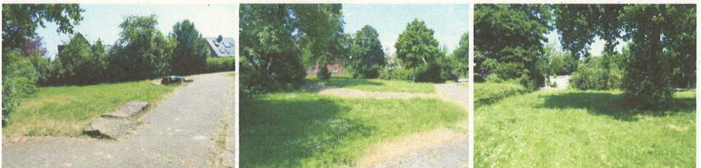
Abb. 3-5: jetziger Bestand

Durch die mit der Reaktivierung des stillgelegten Spielplatzes verbundene deutlich aufwendigere Pflege und Unterhaltung würden allerdings dauerhafte Mehrkosten entstehen, die im derzeitigen Budget der Grünflächenunterhaltung nicht zur Verfügung stehen.