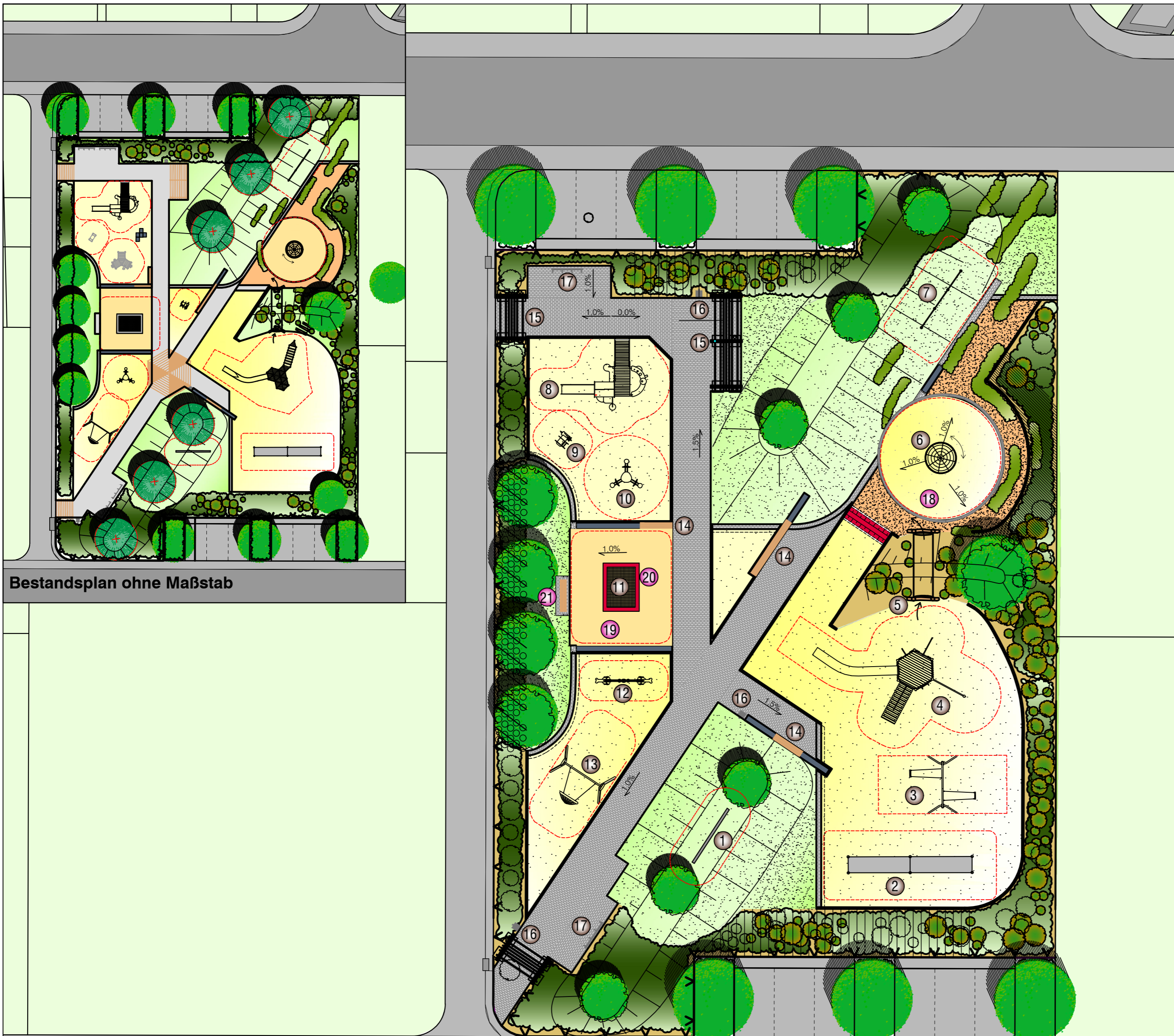
Bestandsplan ohne Maßstab