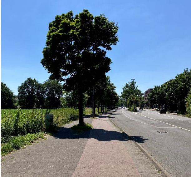
Abb. 2: Bestandssituation Südseite Heumannsweg, Blickrichtung Albersloher Weg

Im Abschnitt Heumannsweg wird der Radverkehr heute beidseitig im Einrichtungsverkehr auf benutzungspflichtigen Radwegen geführt. Der weit überwiegende Teil der Radfahrenden in Richtung Gremmendorf nutzt jedoch verbotswidrig den südlichen Radweg entgegen der Fahrtrichtung als Geisterfahrer (Bestandssituation in Abb. 2 & 3), um die signalisierte Querung am Knotenpunkt Albersloher Weg / Heumannsweg zu umgehen und mit möglichst geringem Zeitverlust von der Fahrradstraße Lindberghweg auf den Bahnseitenweg zu gelangen.