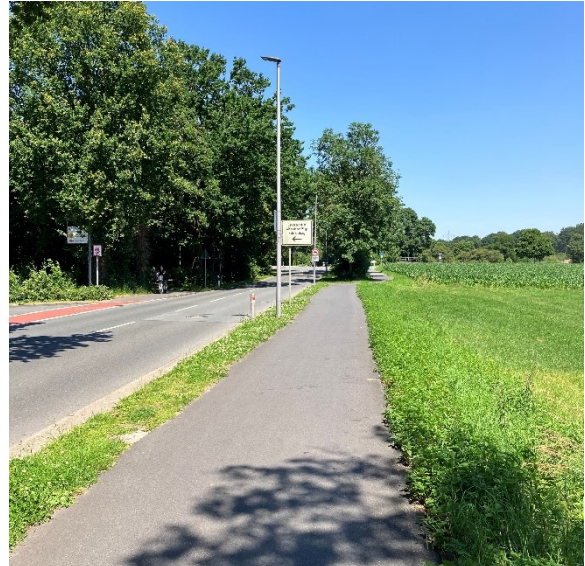
Abb. 3: Bestandssituation Südseite Heumannsweg, Blickrichtung Lindberghweg

Im Rahmen des fortschreitenden Ausbaus der Veloroute 11 Münster-Everswinkel soll die Radverkehrssituation am Heumannsweg verbessert werden. Hierzu ist geplant, entlang der Südseite des Heumannsweges anstelle des bestehenden Einrichtungsradweges einen Zweirichtungsradweg mit begleitendem Gehweg zu errichten (s. Anlage 1). Dieser Planungsansatz orientiert sich an dem offensichtlichen Verkehrsbedürfnis der Radfahrenden und erhöht Komfort und Sicherheit auf dem Veloroutenabschnitt deutlich. Der Zweirichtungsradweg soll am Knotenpunkt Heumannsweg / Lindberghweg als „vierter“ Knotenpunktarm (nur Radverkehr) an die Fahrradstraße Lindberghweg anschließen.