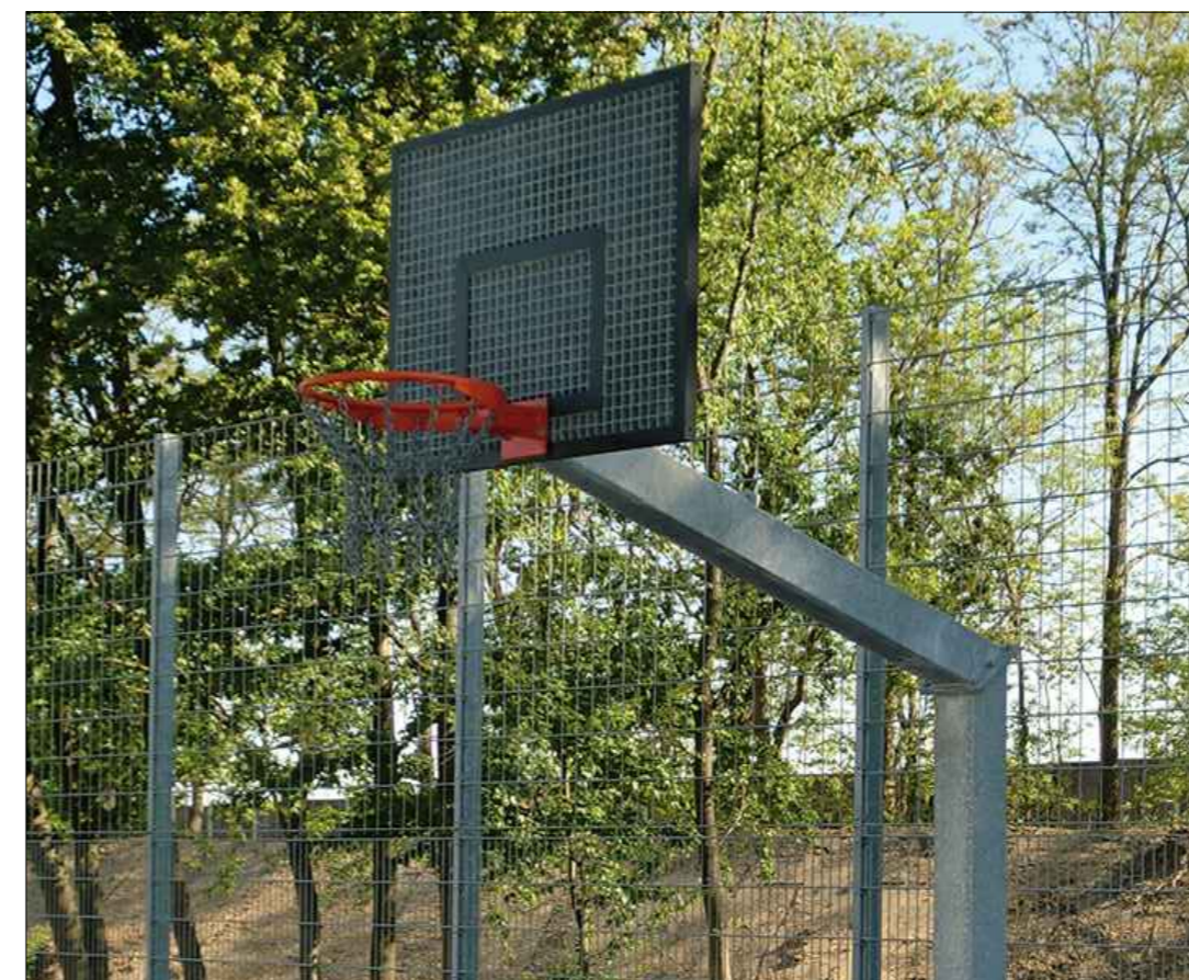
5 Basketballständer "Unbreakable" Fa. Schaeper