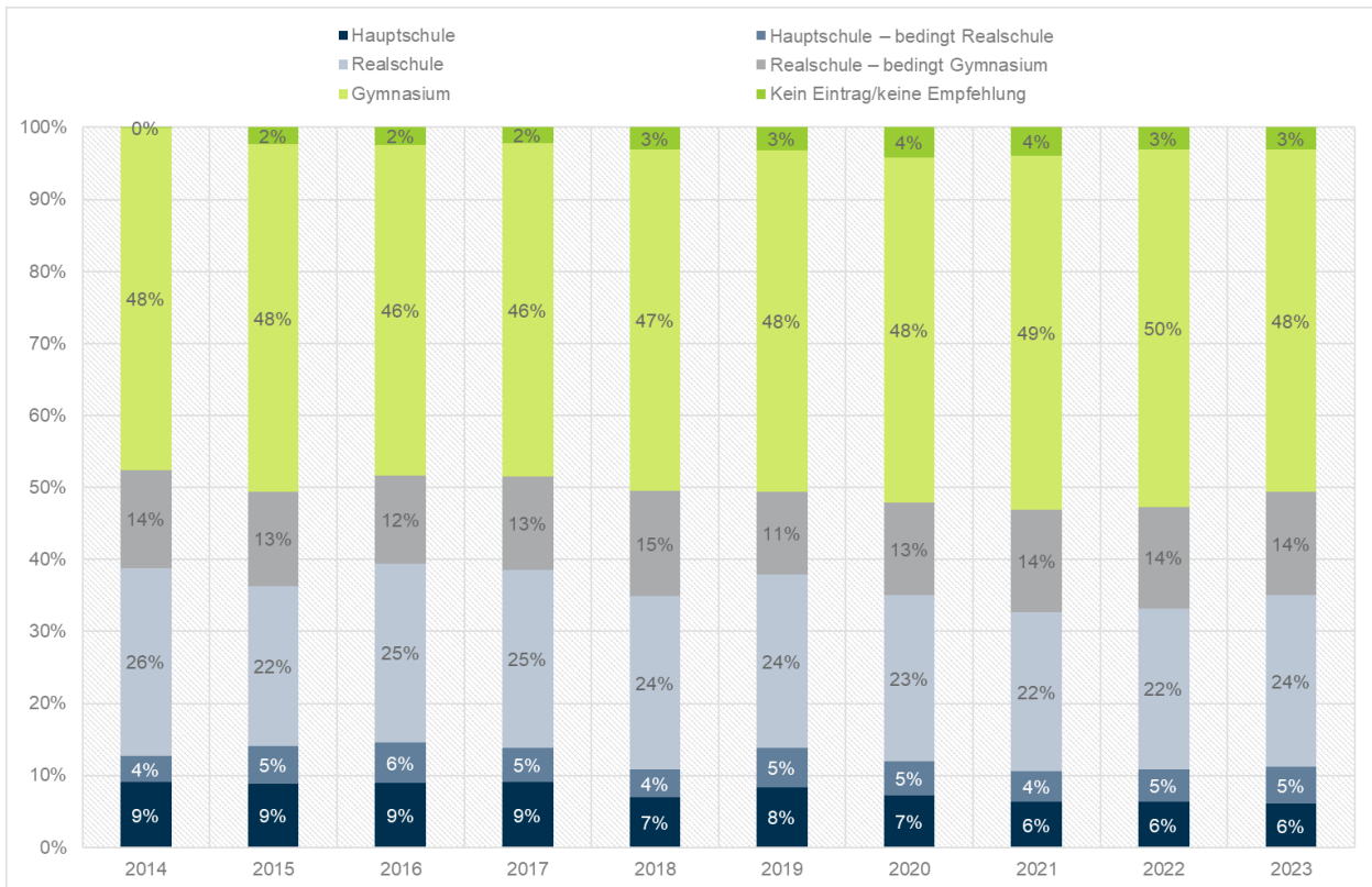
(a) Münster insgesamt