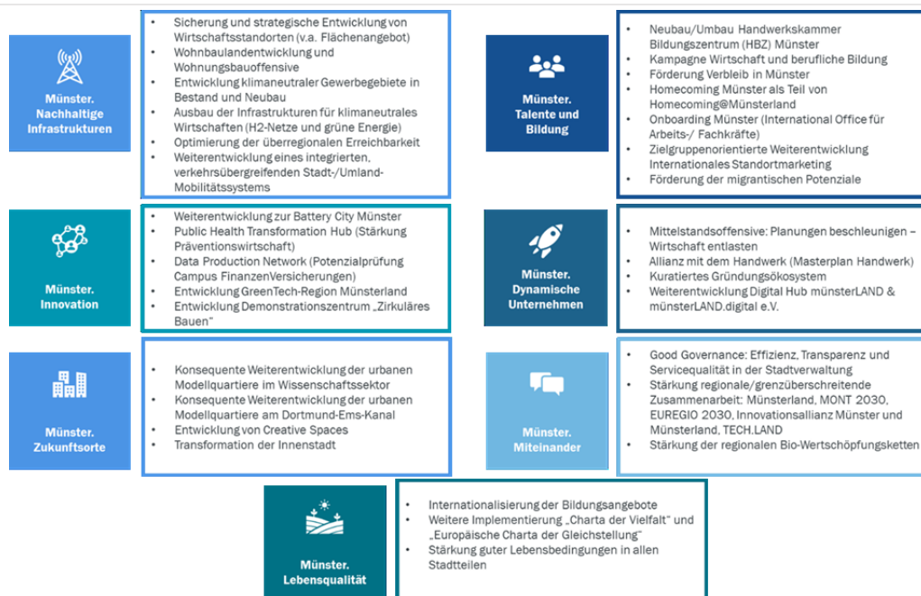
Abbildung Prognos AG, 2024