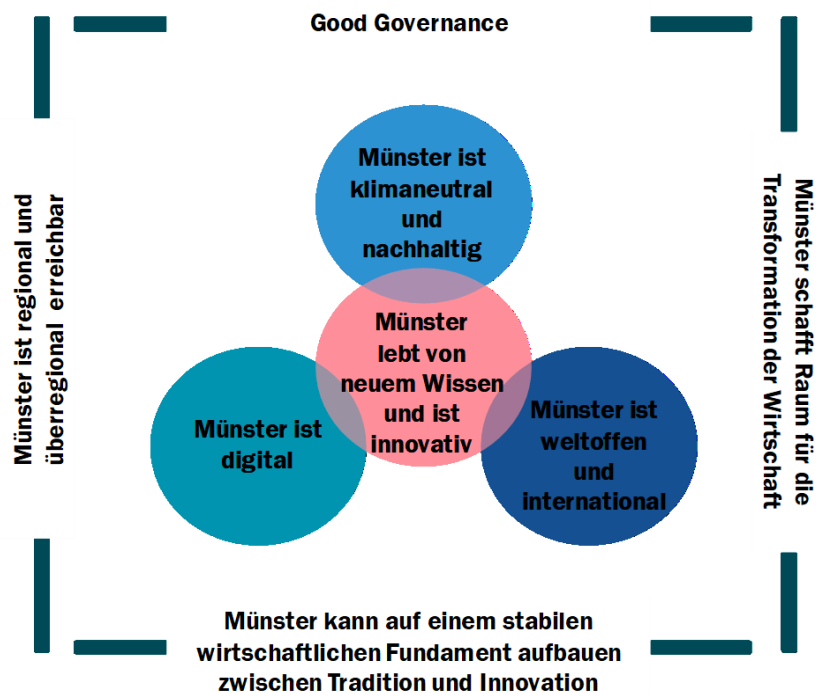
Abbildung 1: Strategische Leitlinien für die Entwicklung des Wirtschaftsstandorts Münster 2030+

Die Vision wird durch die strategischen Leitlinien ergänzt, die übergeordnete Werte und Prinzipien darstellen, die das wirtschaftliche Handeln der Akteurinnen und Akteure in der Stadt Münster im Sinne einer gemeinwohlorientierten, innovativen und nachhaltigen Wirtschafts- und Stadtentwicklung leiten sollen. Weitergehende Erläuterungen enthält Kapitel 3 des Abschlussberichtes (vgl. Anlage 1).