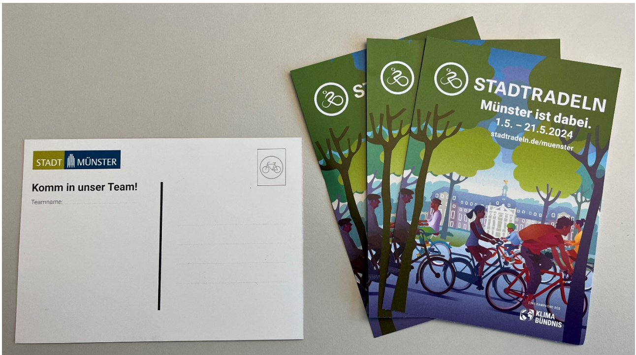
Abbildung 5: Postkarten laden zur Teilnahme an der Aktion ein