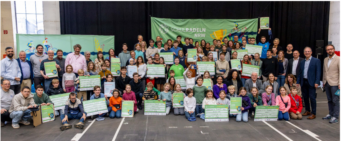
Abbildung 17: Alle Preisträgerinnen und Preisträger des Sonderwettbewerbs „Schulradeln NRW“ bei der Preisverleihung am 20. November in Köln“