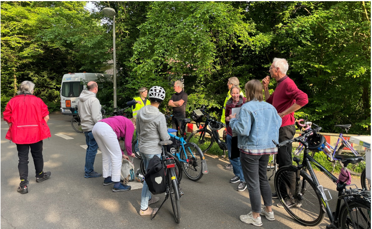
Abbildung 12: Teilnehmende der STADTRADELN-Feierabend-Tour

Im fünften STADTRADELN-Jahr in Folge lud das städtische Fahrradbüro gemeinsam mit dem ADFC Münsterland während des STADTRADELN-Zeitraums zu einer knapp 20 Kilometer langen Feierabend-Tour, um mit interessierten Bürgerinnen und Bürgern und in informellem Rahmen über aktuelle (Rad-)Verkehrsprojekte in Münster ins Gespräch zu kommen. Mit knapp 10 Teilnehmenden konnten so rund 200 weitere STADTRADELN-Kilometer gesammelt und Stimmen und Feedback zu diversen Radverkehrsmaßnahmen aus der Bürgerschaft eingeholt werden. Das zwanglose Format wird seit Beginn des Münsteraner STADTRADELNs von allen Seiten als positiv bewertet und soll auch in 2025 seine Wiederholung finden.