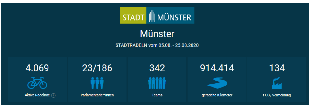
Abbildung 13: Ergebnisübersicht STADTRADELN Stadt Münster im Vergleich – 2024 (oben), 2023, 2022, 2021, 2020 (unten)