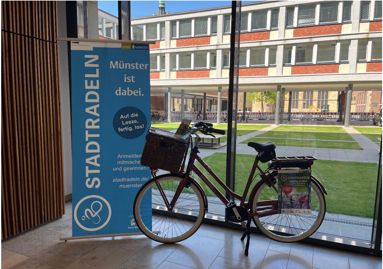
Abbildung 7: Der Hauptpreis der Verlosungsaktion – ein E-Bike inkl. einjährigem Versicherungsschutz – stand während des Durchführungszeitraums als Blickfang in der Münster-Information im Stadthaus 1

Um die Motivation zu erhöhen, am STADTRADELN teilzunehmen, konnten wie auch in den Vorjahren Preise erradelt werden. So wurden im Nachgang an die Aktion die beiden besten Einzelradelnden (männlich / weiblich) sowie das Team (bestehend aus mindestens zehn Personen) mit den radelaktivsten Mitgliedern (Durchschnittswert) prämiert. Das Team mit der höchsten Gesamtkilometerleistung wurde mit dem symbolischen Wanderpokal „Das goldene Rad“ geehrt.