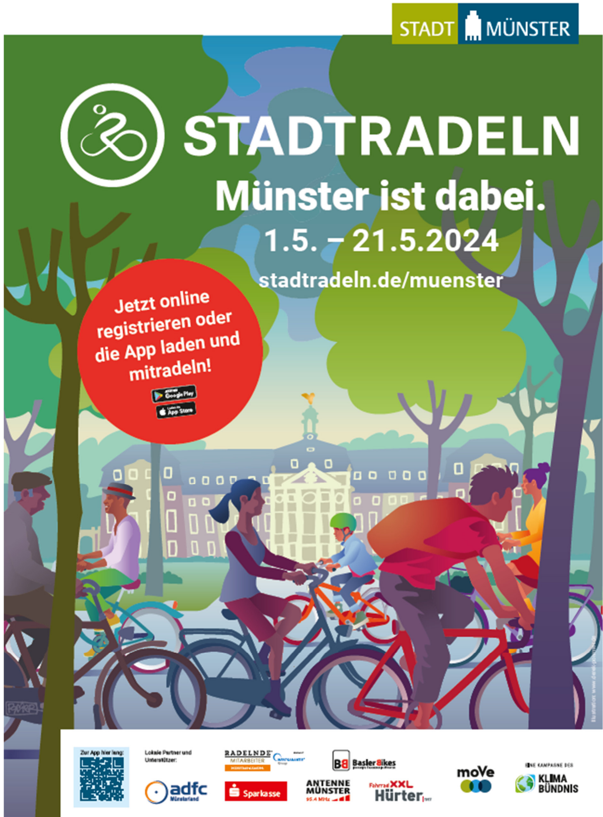
Abbildung 2: Plakat zu STADTRADELN 2024