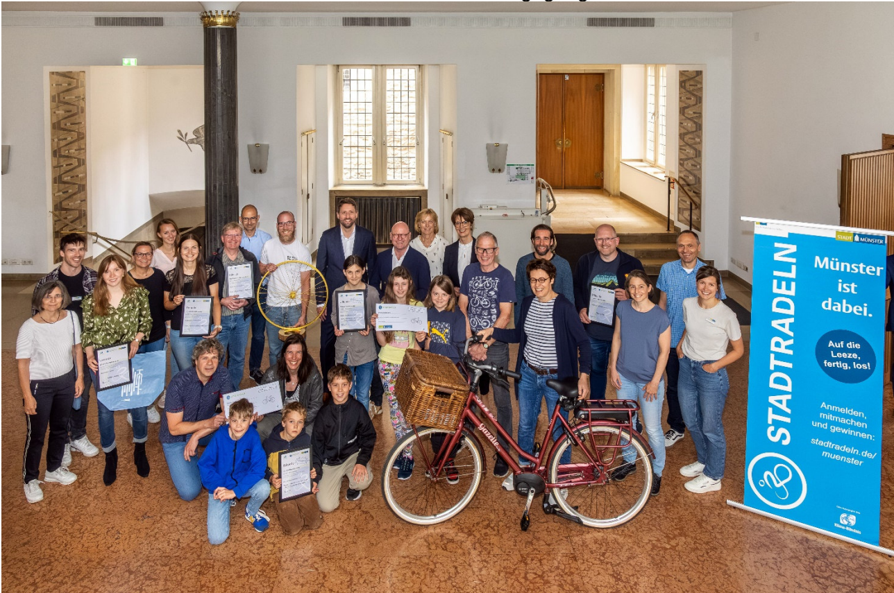
Abbildung 16: Preisverleihung STADTRADELN 2024 mit allen Preisträgerinnen und Preisträgern

Besonderer Dank für das persönliche Engagement und für die Unterstützung wurde auch den beiden STADTRADELN-Stars sowie dem ADFC Münsterland entgegengebracht.