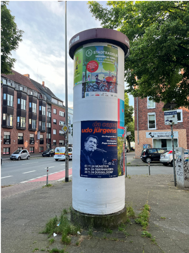
Abbildung 3: Litfaßsäule an der Friedrich-Ebert-Straße