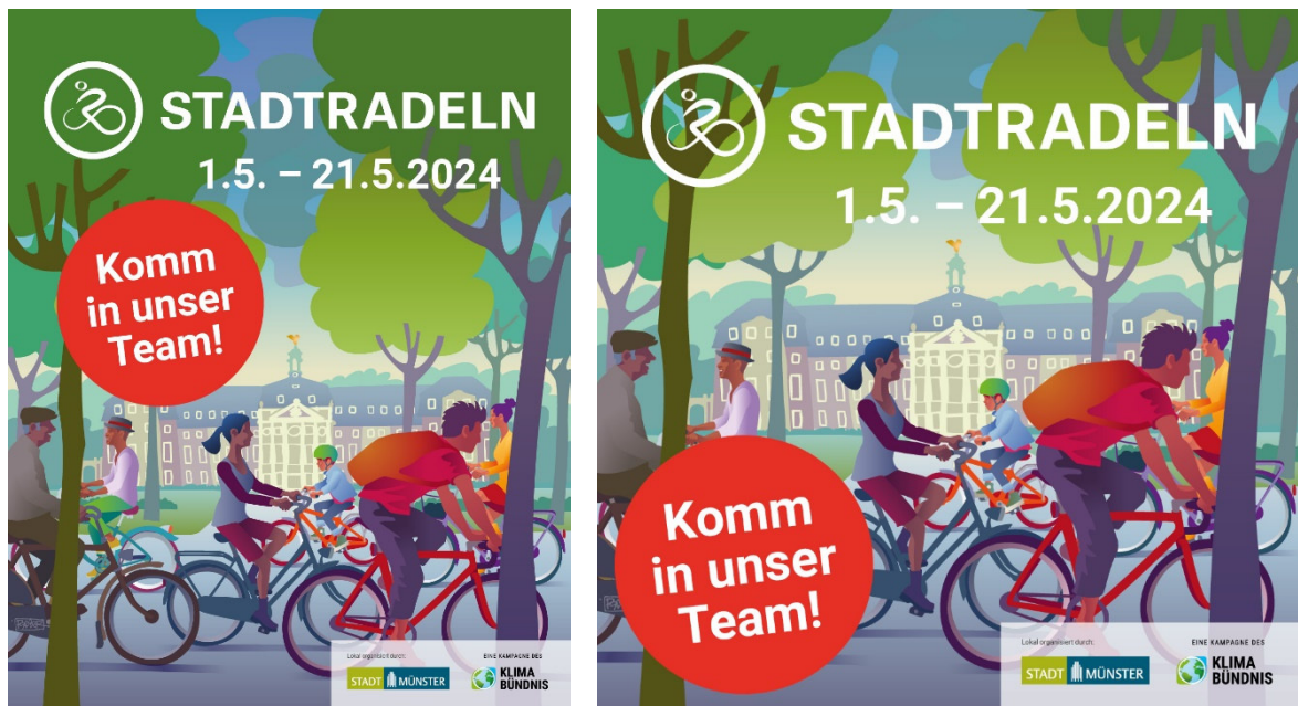
Abbildung 4: Sharepics in den entsprechenden Formaten für Facebook und Instagram