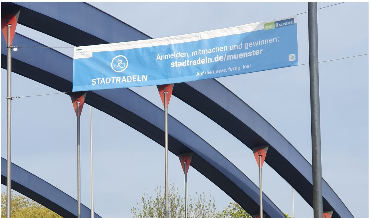
Abbildung 6: STADTRADELN-Banner am Albersloher Weg

Darüber hinaus wurden eigene Kommunikationskanäle des Fahrradbüros, von Münster Marketing bzw. der Stabsstelle Klima genutzt, um auf STADTRADELN aufmerksam zu machen (z.B. Newsletter). Der ADFC Münsterland hat mehrere umfassende Einträge zum Münsteraner STADTRADELN auf seiner Homepage bzw. im Leezen-Kurier veröffentlicht.