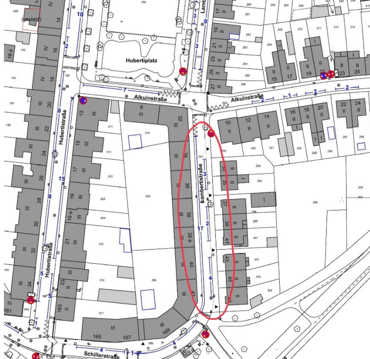
Abbildung 3: Lambertstraße südlich der Alkuinstraße