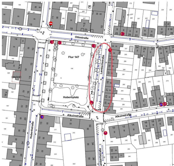
Abbildung 2: Lambertstraße zwischen Ottostraße und Alkuinstraße