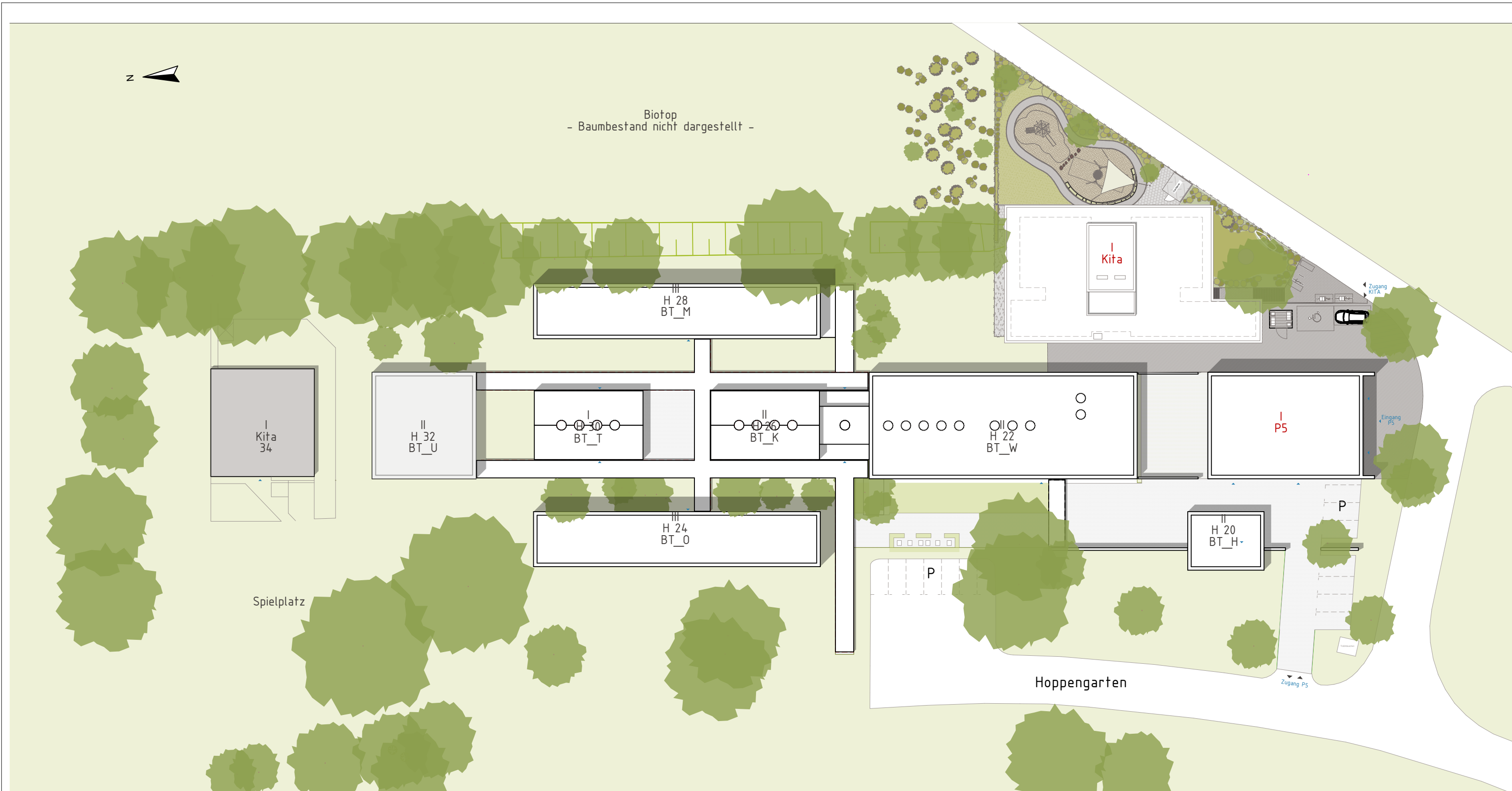
AB-182a Lageplan Baubeschluss 1:500

BAUVORHABEN: KiHo Neubau KiTa am Hoppengarten Hoppengarten 48147 Münster