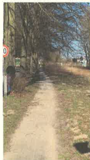
Ausführung des Fuß- und Radweges als Ascheweg entlang der Eichen-Baumreihe bis zur Gildenstraße