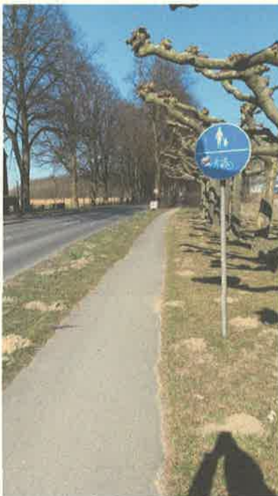
Fuß- und Radweg im Bereich Parkplatz des Gartencenters