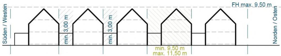
Abb. 1 Darstellung der abweichenden Bauweise für Gebäude mit Satteldach – ohne Maßstab

Für die Baugebiete WA 1, WA 2, WA 6, WA 7 und WA 9 ist eine abweichende Bauweise "a" festgesetzt.