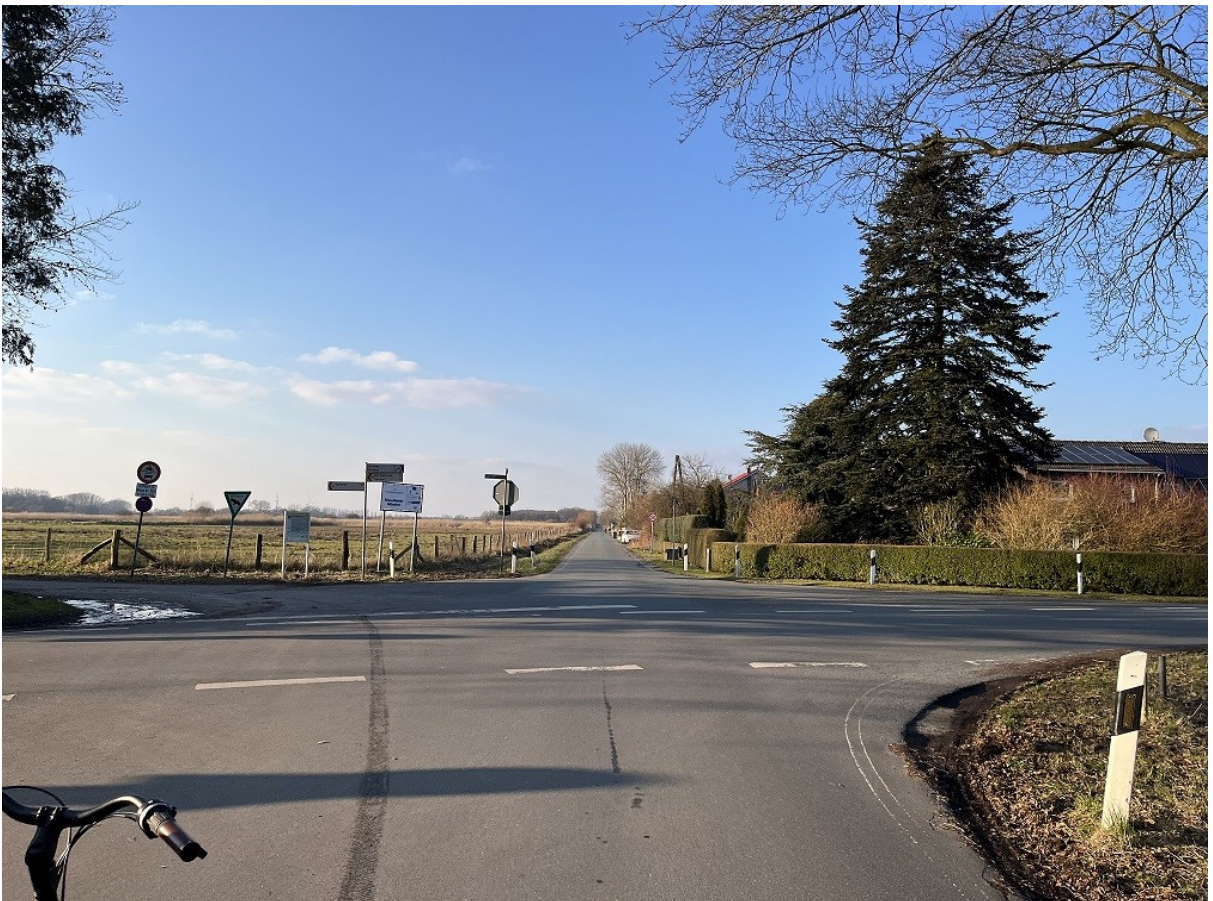
Abb. 3, 4 & 5: Bestandssituation Hessenweg