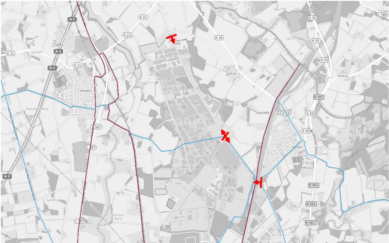
Abb. 2 Verortung des Streckenabschnittes im Fahrradnetz 2.0 (violett: Veloroute, hellblau: Basisroute)