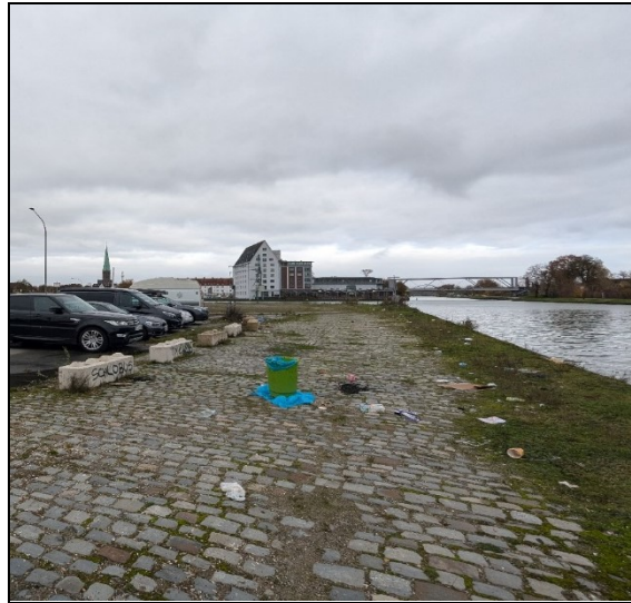
Abbildung 3: Blick entlang der Hafenkante.

In Zukunft hingegen wird dieser Standort von attraktiven Orten, Gebäuden und Einrichtungen umgeben sein. Wichtige Projekte, die diesen Wandel prägen, sind unter anderem der Neubau des Stadthauses 4, das Bauvorhaben „Die drei Schwestern“, die Quartiersentwicklung „MMQ 3 – Theodor-Scheiwe-Straße“ sowie der Bebauungsplan Nr. 541. Letzterer umfasst große Teile des Hafensareals und setzt entscheidende Impulse für die weitere Entwicklung des Gebiets.