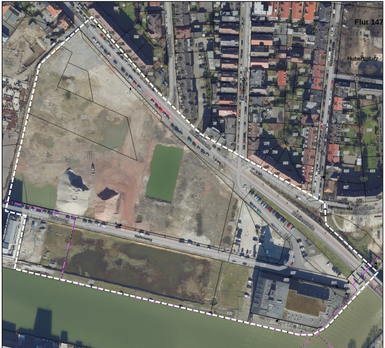
Abbildung 3: Plangebiet (gestrichelte Linie).

Das EU-weite Natura 2000-Netz beinhaltet die Schutzgebiete der Vogelschutz-Richtlinie sowie die Schutzgebiete der Fauna-Flora-Habitat-Richtlinie (FFH-Richtlinie). Südöstlich des Plangebietes liegt in einer Entfernung von ca. 7 km das FFH-Gebiet DE-4012-301 „Wolbecker Tiergarten“. In nördlicher Richtung, in ca. 6,5 km Entfernung liegt das Vogelschutzgebiet „Rieselfelder Münster“. Aufgrund der gegebenen Entfernungen zu den genannten europäischen Schutzgebieten und der beabsichtigten Planung ergeben sich keine umweltrelevanten Vorgaben.