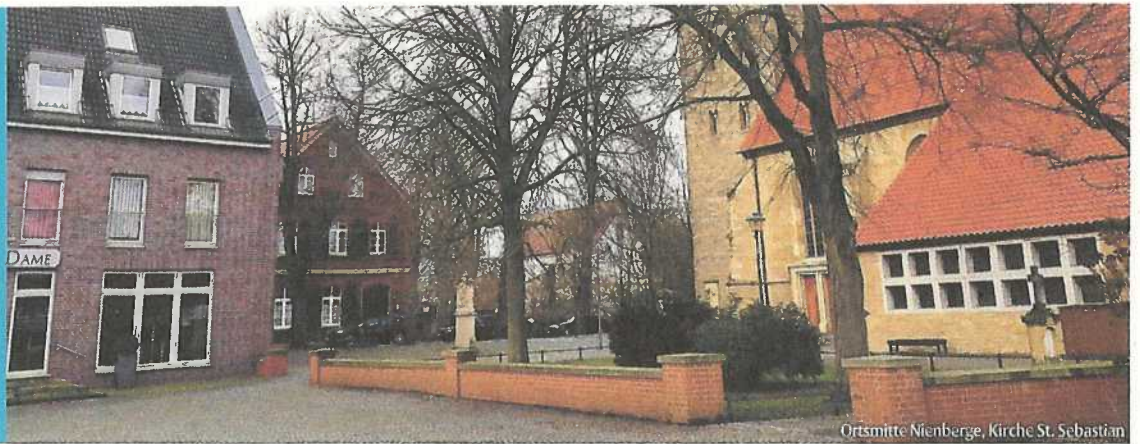
Ortsmitte Nienberge, Kirche St. Sebastian