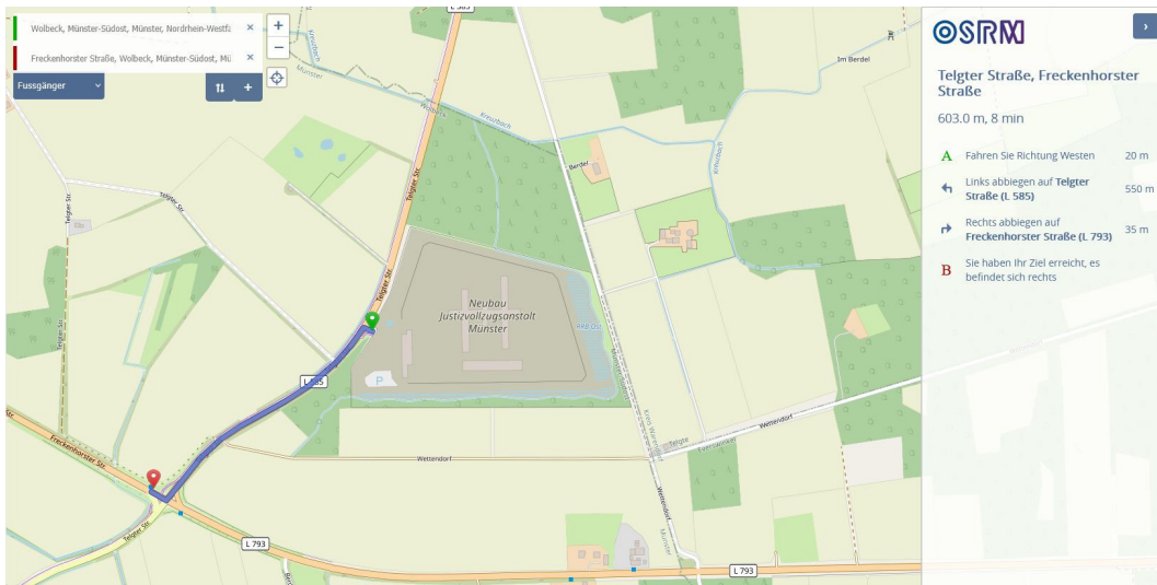
Abbildung 1: Fußweg neue JVA zur Schnellbushaltestelle Telgter Straße/L793