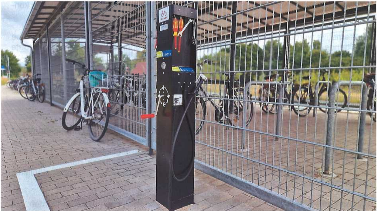
Anlage 2: Radservicestation am Haltepunkt Mecklenbeck