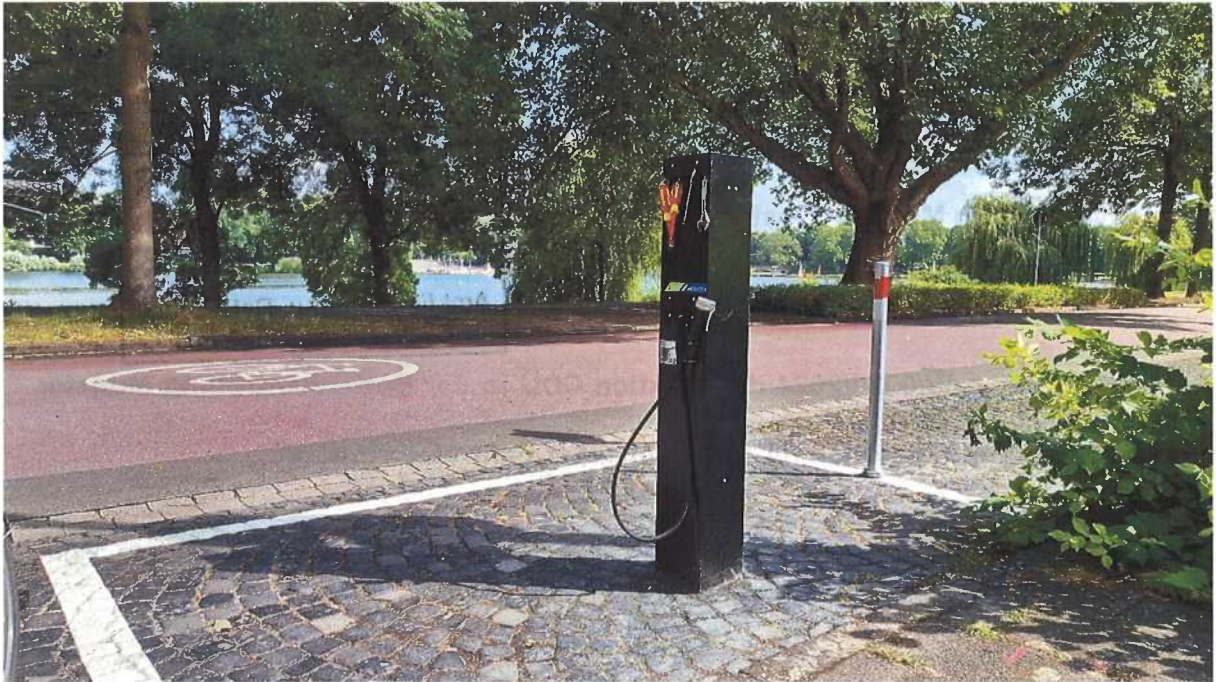
Anlage 1: Radservicestation Bismarckallee