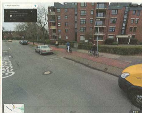
(b) Gescherweg Auffahrt auf den Radweg