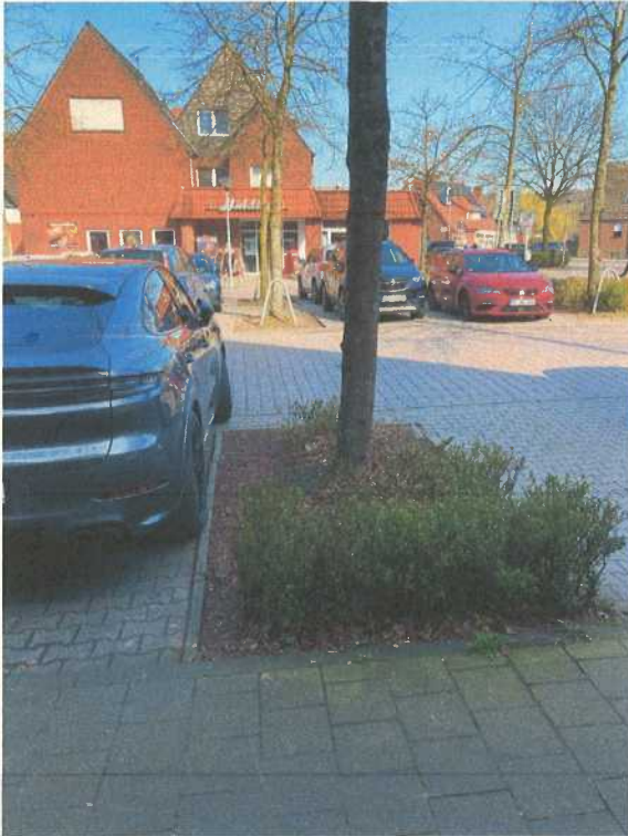
Abbildung 3: Beispiel für die enge Parksituation