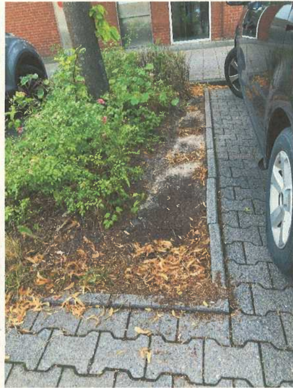
Abbildung 4: zertrampelte Pflanzung