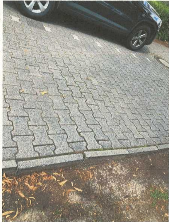
Abbildung 2: Schäden an Pflaster und Einfassungen