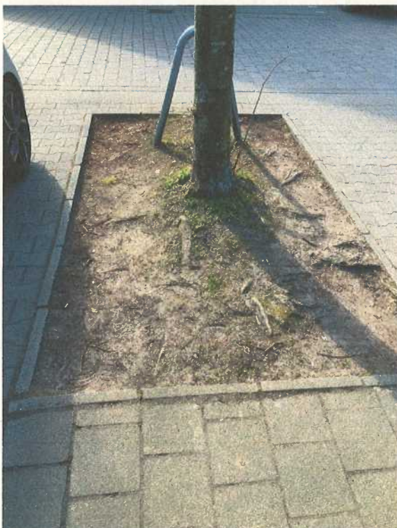
Abbildung 5: oberflächennahe Wurzeln

Da eine nachhaltige Lösung für den kompletten Bereich der Sebastianstraße mit den gegebenen Mitteln nicht umsetzbar ist, wird Folgendes vorgeschlagen: